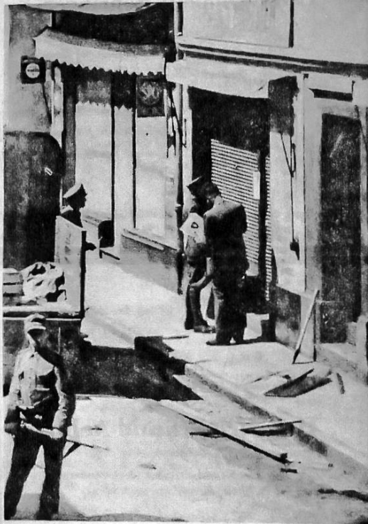
Im Einverständnis mit den deutschen Besetzungsbehörden läßt das schweizerische Konsulat in Lyon an den Gebäuden in Französisch-St. Gingolph, die Eigentum von Schweizern sind, Eigentumsdeklarationen anschlagen