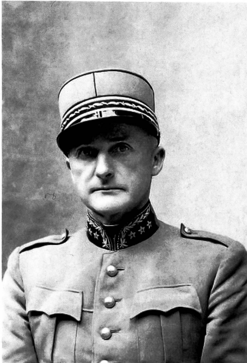
Abb. 1: Oberstbrigadier Julius Schwarz (1887–1965). Die «Revue Militaire Suisse» (Bd. 110/1965, S.385–387) erinnerte in ihrem Nachruf an St-Gingolph: «La petite ville où s'affrontaient des soldats allemands et des hommes de la Résistance française flambait. Schwarz se rend sur place, discute énergiquement avec les Allemands et réussit à mettre un terme à leurs sanglantes représailles. Il avait pris seul le risque de sa courageuse et humanitaire intervention ... sur sol étranger!» (Abbildung: www.notrehistoire.ch )