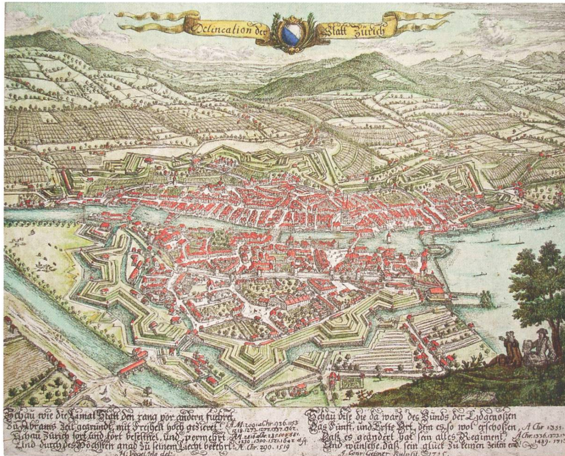
Die Stadt Zürich im beginnenden 18. Jahrhundert. Kolorierter Kupferstich von Johann Konrad Gessner (1677–1737), 1715. (Privatbesitz von Felix Richner, Bubikon.)