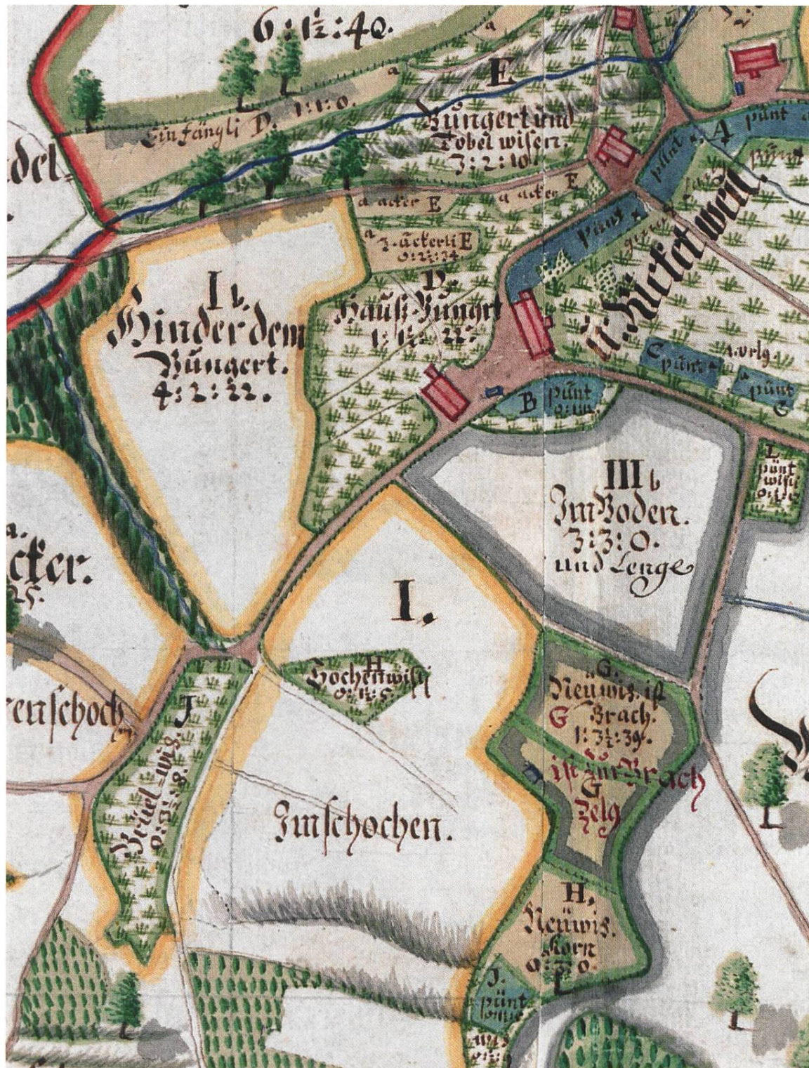
Abb. 6: Zehntenplan von Ricketwil 1739, Ausschnitt. Unterricketwil mit Haus- und Obstgärten. Der Eingang «G Neuwis», anschliessend an ein Stück der Brachzelg «III Im Boden», gehört neu zur Brachzelg, der Eingang «H Neuwis» zur Kornzelg. (Staatsarchiv Zürich, PLAN Q 322.)