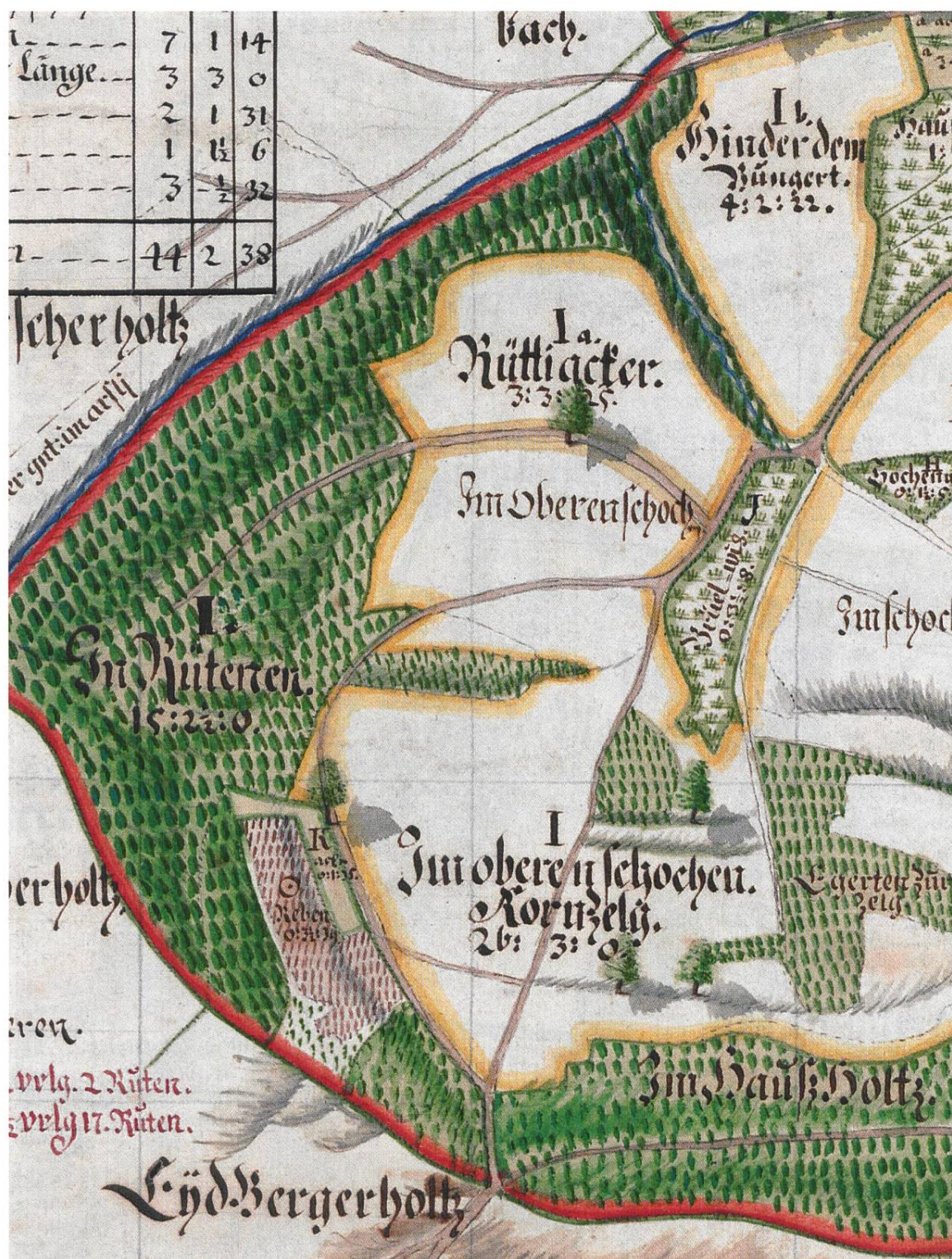
Abb. 7: Zehntenplan von Ricketwil 1739, Ausschnitt. Die Flurnamen «Rüttiacker» und für den angrenzenden Wald «In Rütenen» deuten auf eine Feld-Wald-Wechselwirtschaft hin. Am steilen, nach Norden gerichteten Hang wuchs etwa eine Juchart Reben.