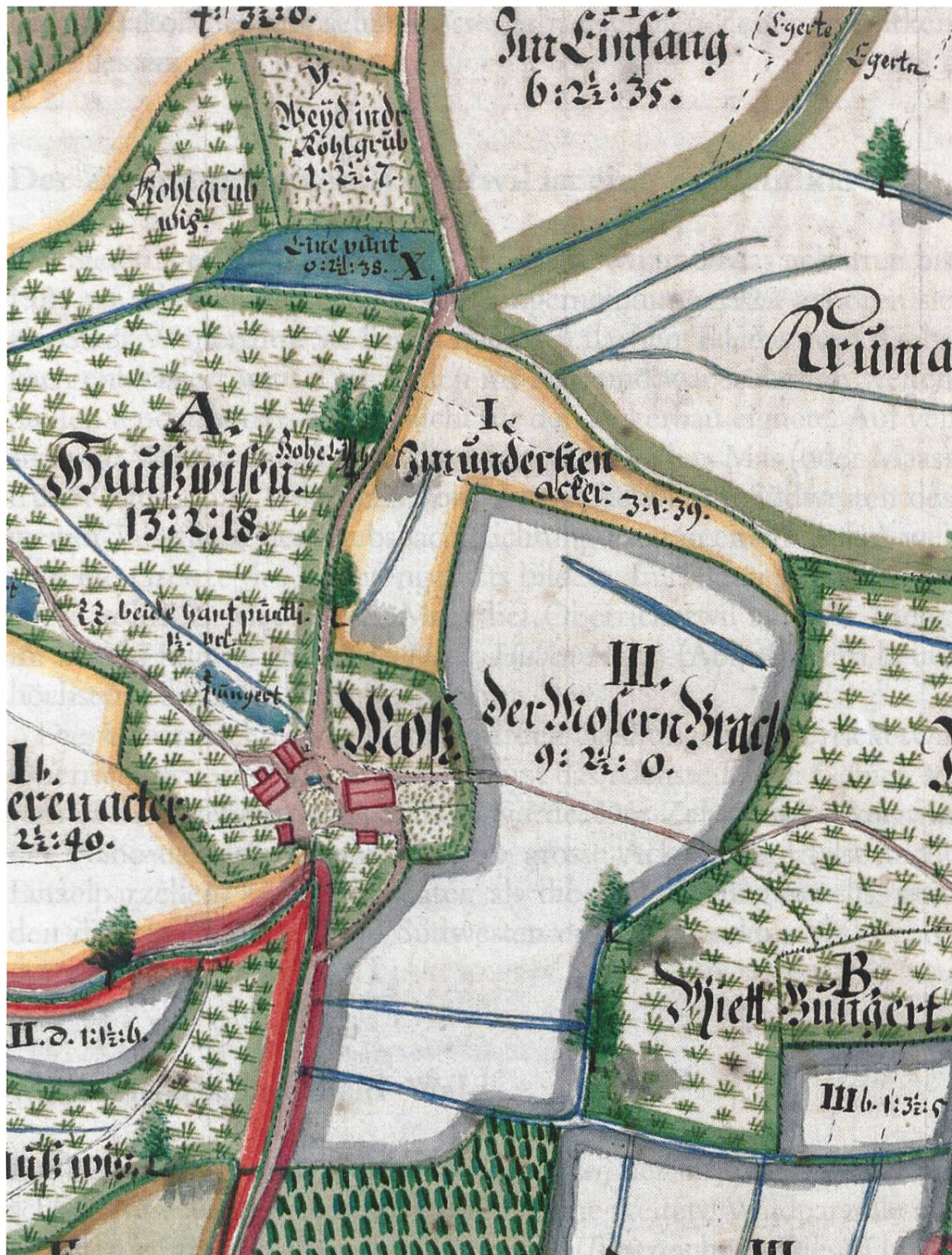
Abb. 8: Zehntenplan von Ricketwil 1739, Ausschnitt des Zehntenbezirks von Mas. Das zur Haberzelg II gehörende Grundstück «Im Einfang» (oben) wurde erst spät in die Dreizelgenwirtschaft integriert. (Staatsarchiv Zürich, PLAN Q 322.)