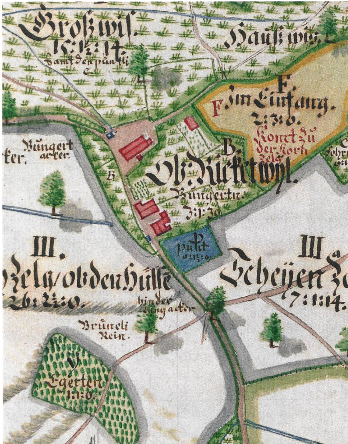
Abb. 5: Zehntenplan von Ricketwil 1739, Ausschnitt. Der Einfang F neben den Haus- und Obstgärten von Oberricketwil «Kommt zu der Kornzelg». Von der 2 Jucharten und 3 Vierling grossen Fläche muss neu der Zehnten abgegeben werden. Die «Egerten Y» war 1739 bewaldet und wurde nicht umgezont. (Staatsarchiv Zürich, PLAN Q322.)