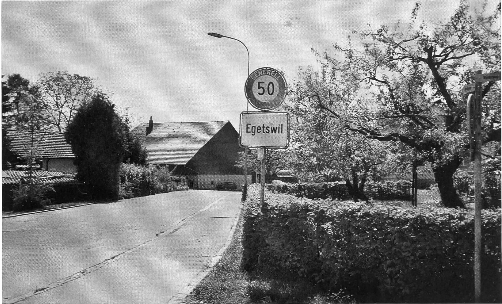
Abb. 1: Ortstafel Egetswil (Kloten).