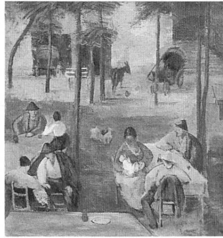
«Tessiner Grotto», 1919, Öl auf Leinwand (Kunstmuseum Winterthur)