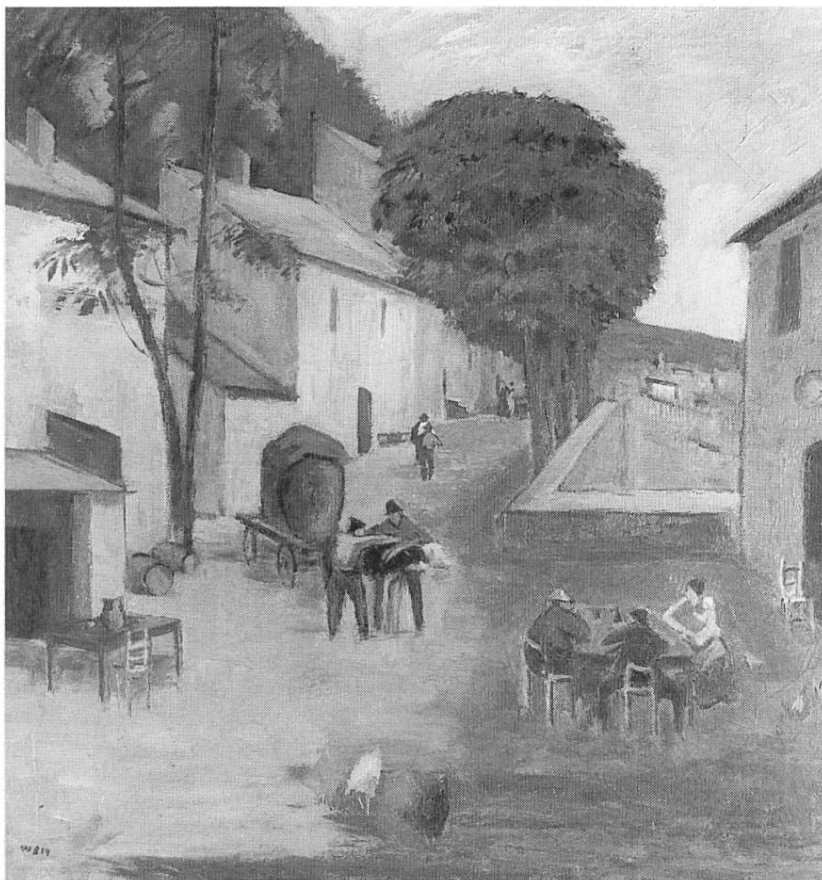
«Tessiner Grotto», 1919, Öl auf Leinwand (Kunsthaus Zürich)