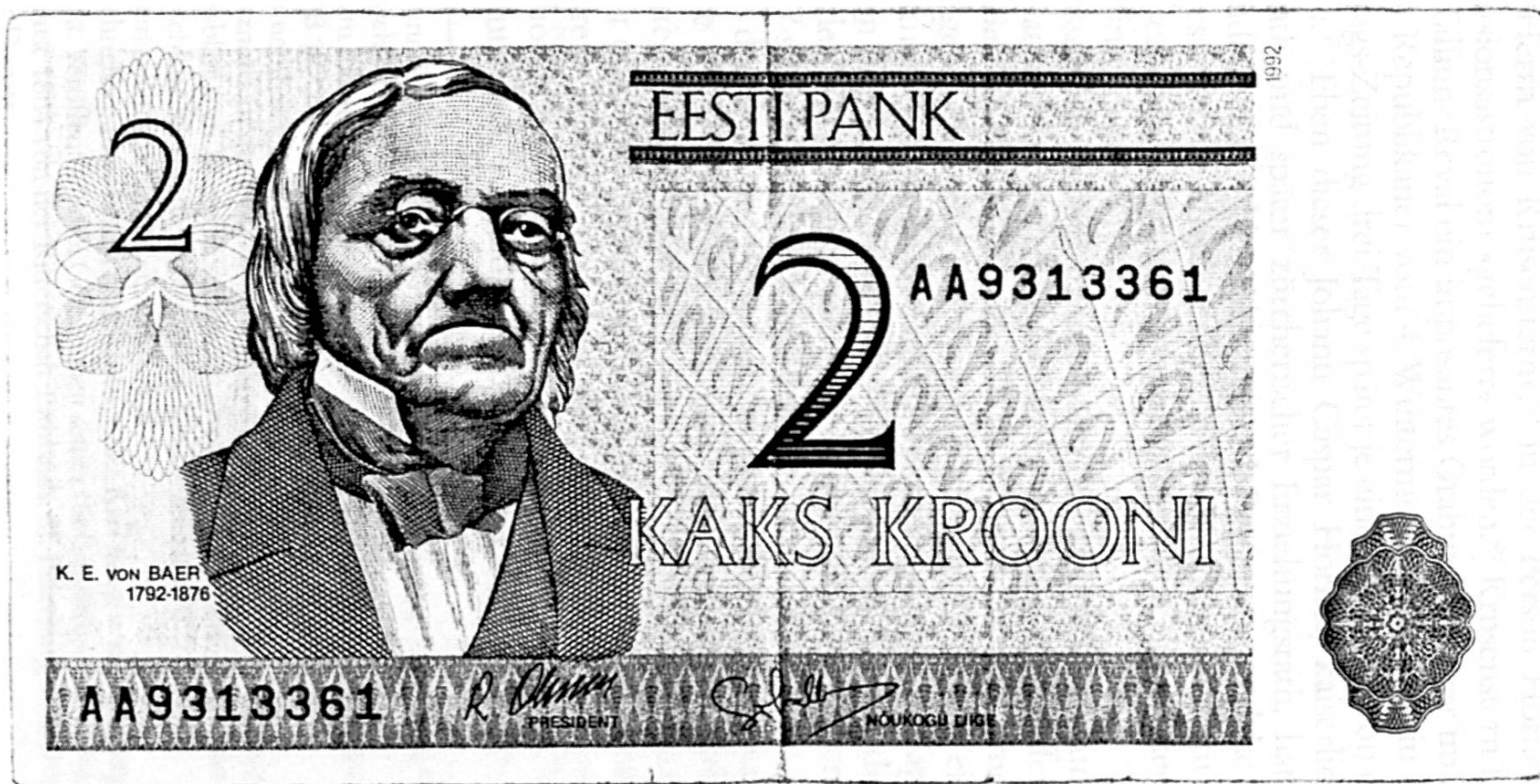
Karl Ernst von Baer (1792–1876) auf estnischer Banknote