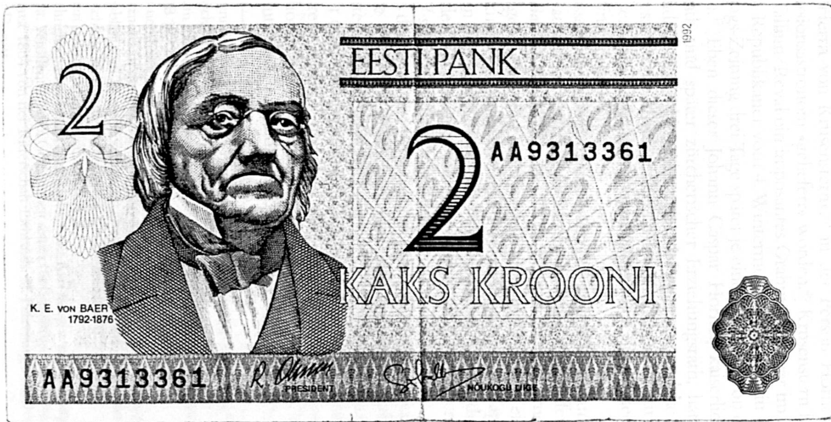
Karl Ernst von Baer (1792–1876) auf estnischer Banknote