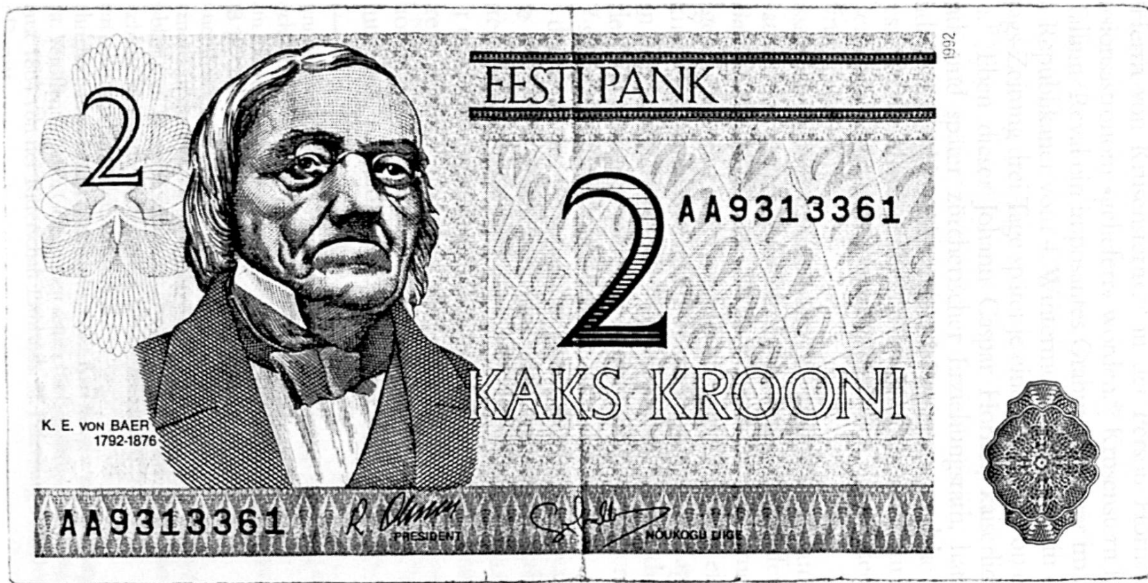
Karl Ernst von Baer (1792–1876) auf estnischer Banknote