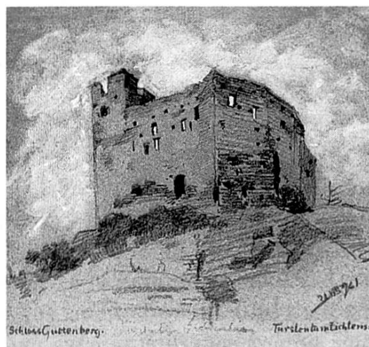
«Schloss Gutenberg», 1896, Bleistift (Privatbesitz)