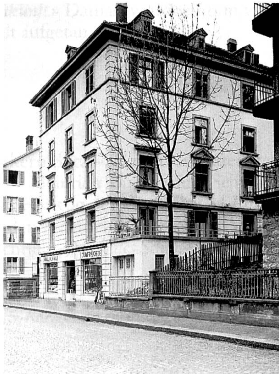
Das Haus Waffenplatzstrasse 17 in Zürich-Enge, das Heinrich Buchmann-Sutz 1895 käuflich erwarb, blieb Wilfried Buchmanns offizielles Domizil bis zu seinem frühen Tod im Jahre 1933 – (Foto aus dem Jahr 1929)