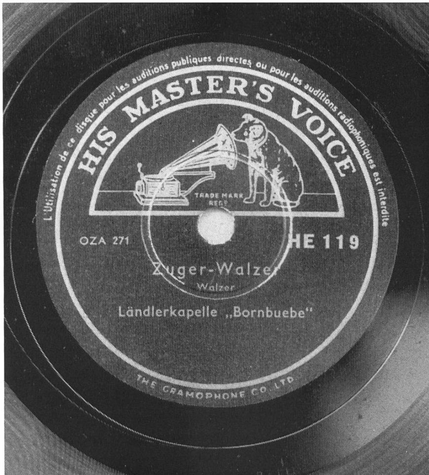
Abbildung 6: Grünes HMV-Etikett der HE-Bestellnummerserie; ohne «Engel»-Schutzmarke (ab ca. 1939).