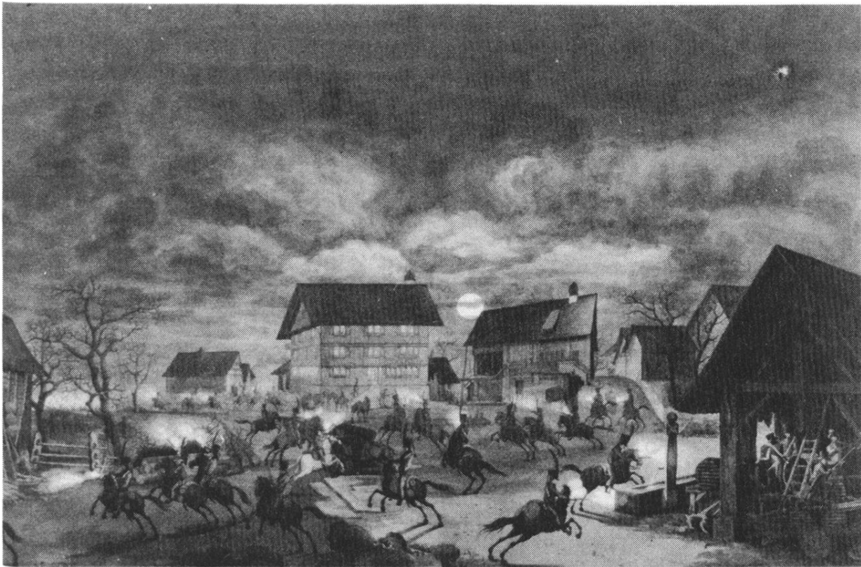
Einnahme von Affoltern am Albis am 27./28. März 1804 durch die Chevau-legers

Schwarz-weiss Stich von J. J. Aschmann.