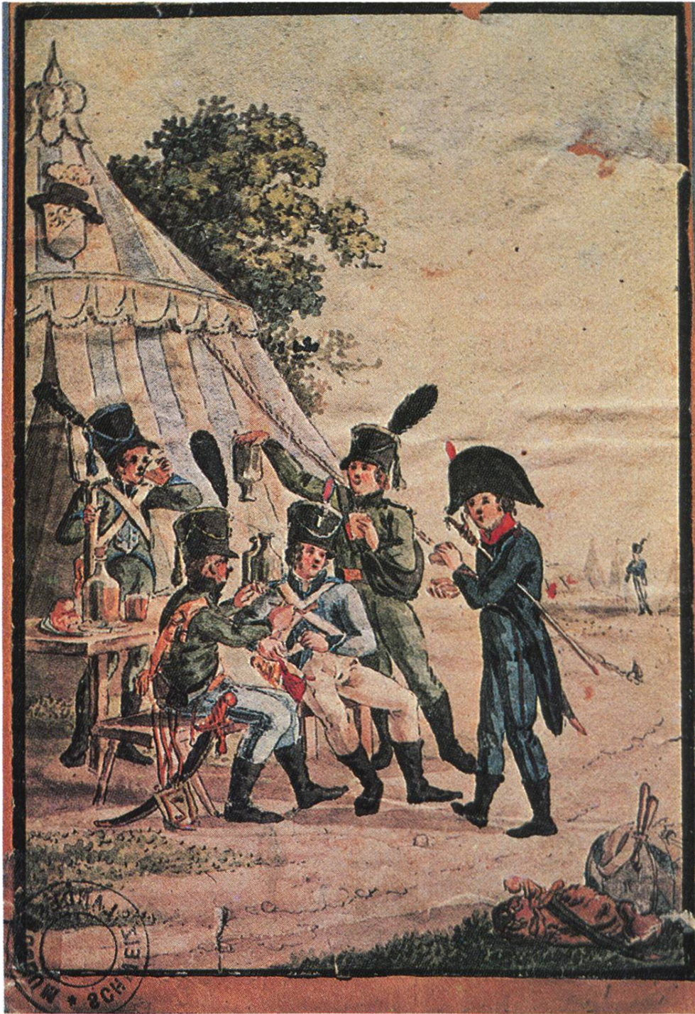
Lagerszene der Standeslegion (1804 – 1816) mit von rechts nach links Jäger, Chevau-leger, Füsilier, Scharfschütze und Kanonier

(Photo Landesmuseum Zürich nach einem zeitgenössischen anonymen Aquarell).