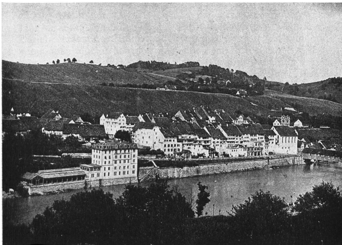
1919 Das Kurhaus kurz vor dem Abbruch der Holzbrücke