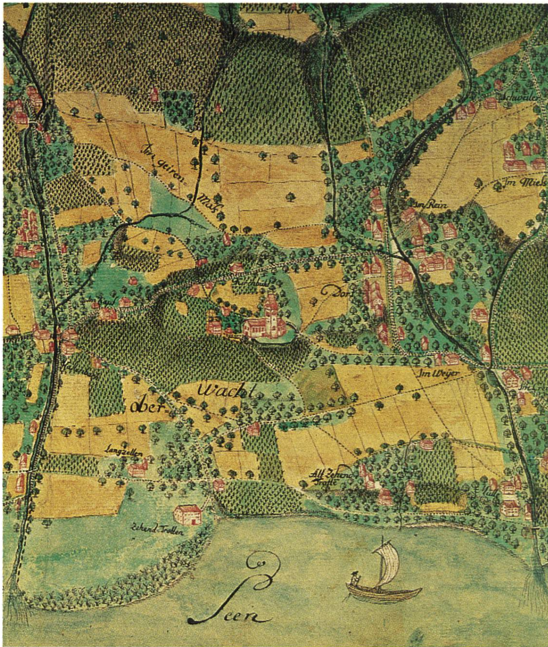
Ausschnitt aus dem «Grund-Riss von der ehrsamten Gemeind Stäffan und sonderlich der Unteren Wacht». Handzeichnung von 1783. Kartensammlung der Zentralbibliothek. Vgl. S. 76 Photo Scheidegger, Zürich.