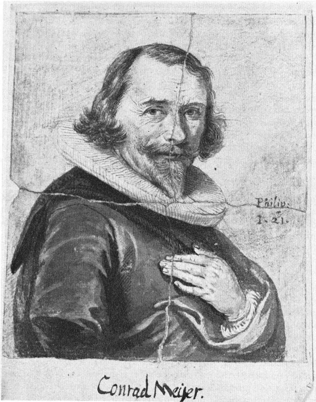
Conrad Meyer Selbstbildnis, 1675