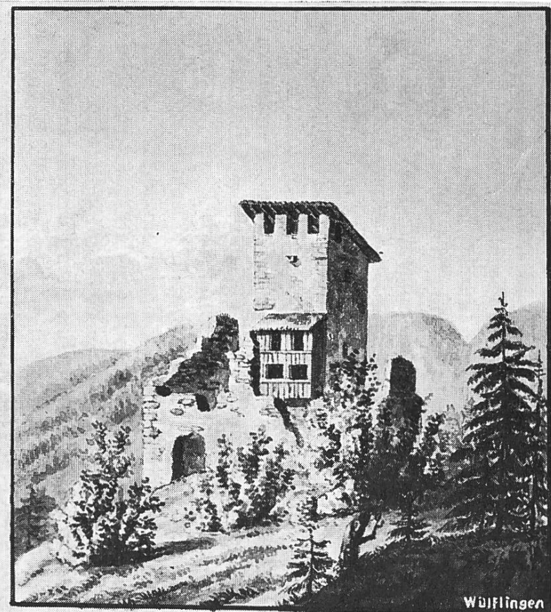
Die Burg Alt-Wülflingen um 1840