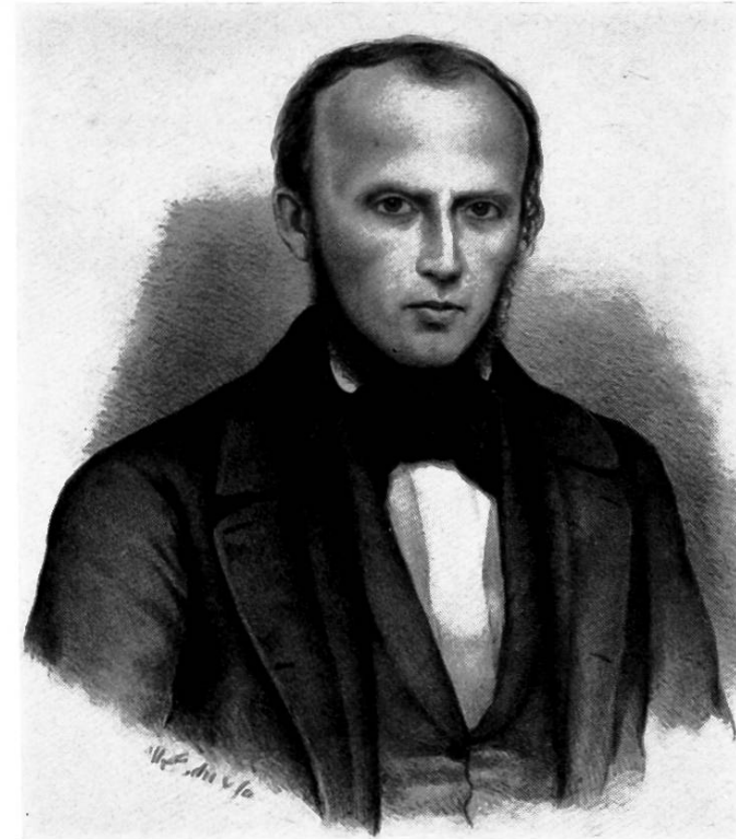
Heinrich Grunholzer 1819–1873 Nationalrat 1860–1873