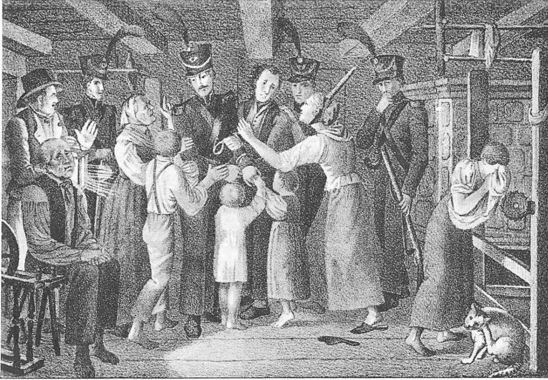
Verhaftung eines Maschinenstürmers im Zürcher Oberland durch Zürcher Miliz.

Der Lithograph C. Studer gehörte zu den geheimen Bewunderern und Sympathisanten der Revoltierenden. Seine Darstellung zielt darauf ab, den Betrachter mitleidig zu stimmen.