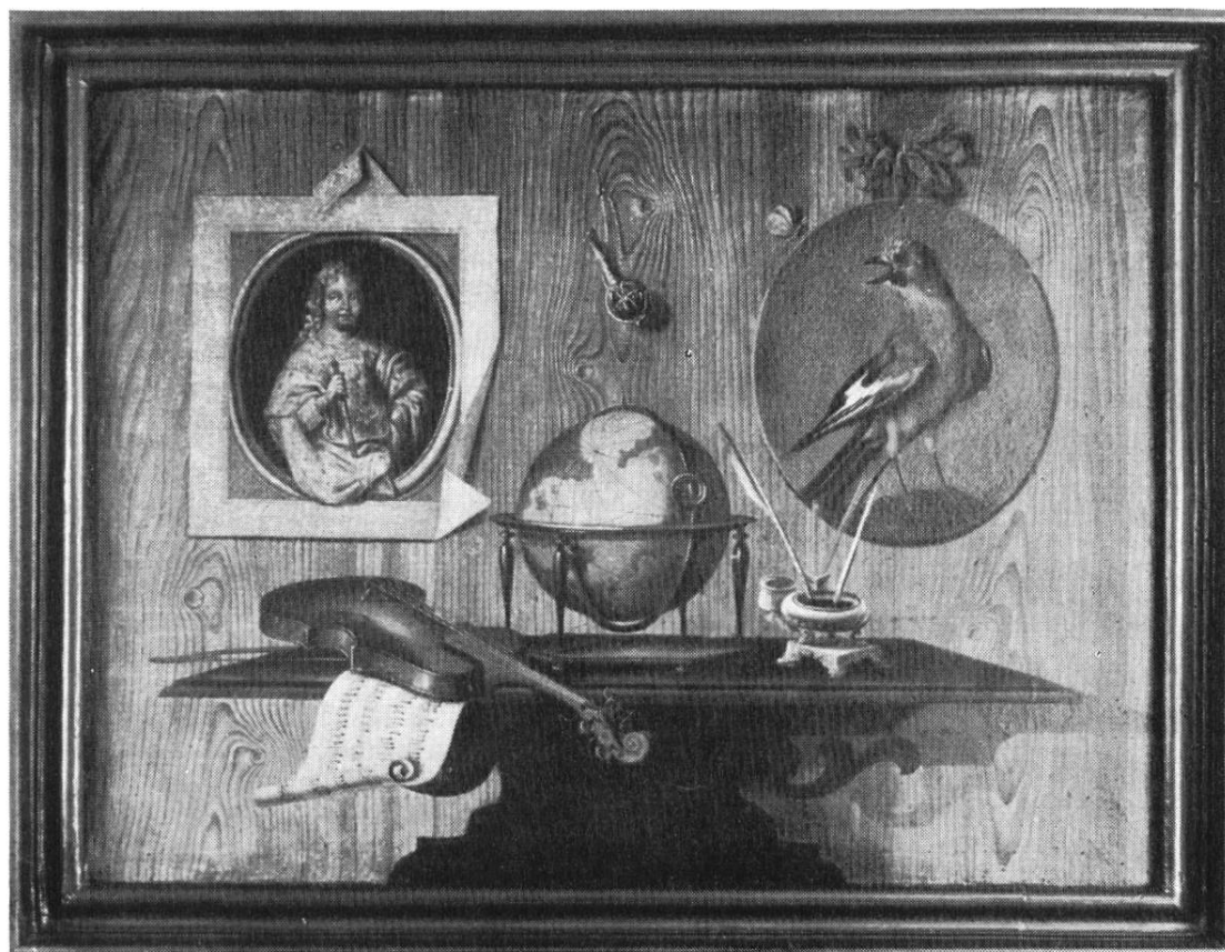
Wandschmuck im Hause „zum Weißen Turm“ von Joh. Kaspar Füssli