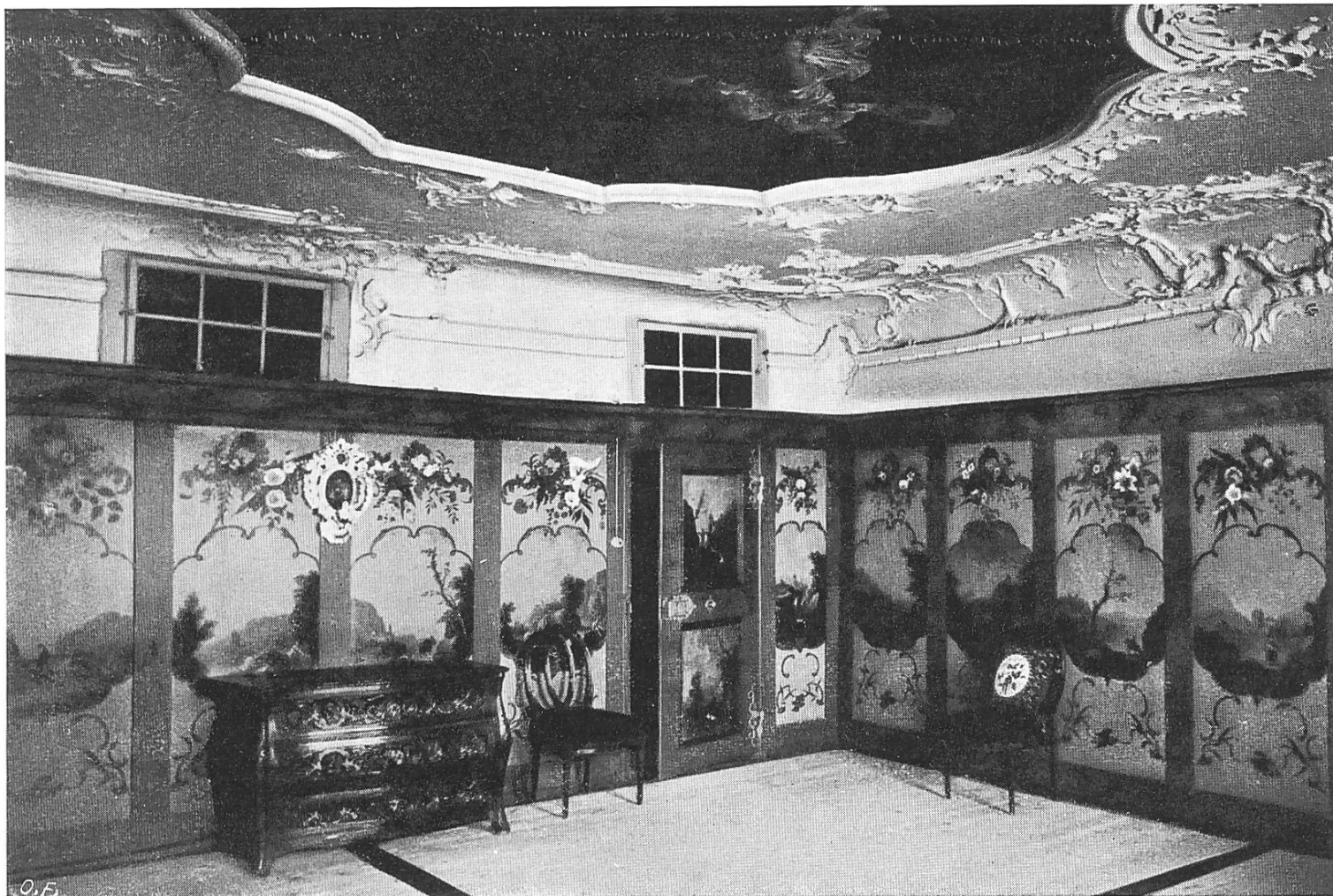
Festsaal im „Neubu“ zu Stein am Rhein