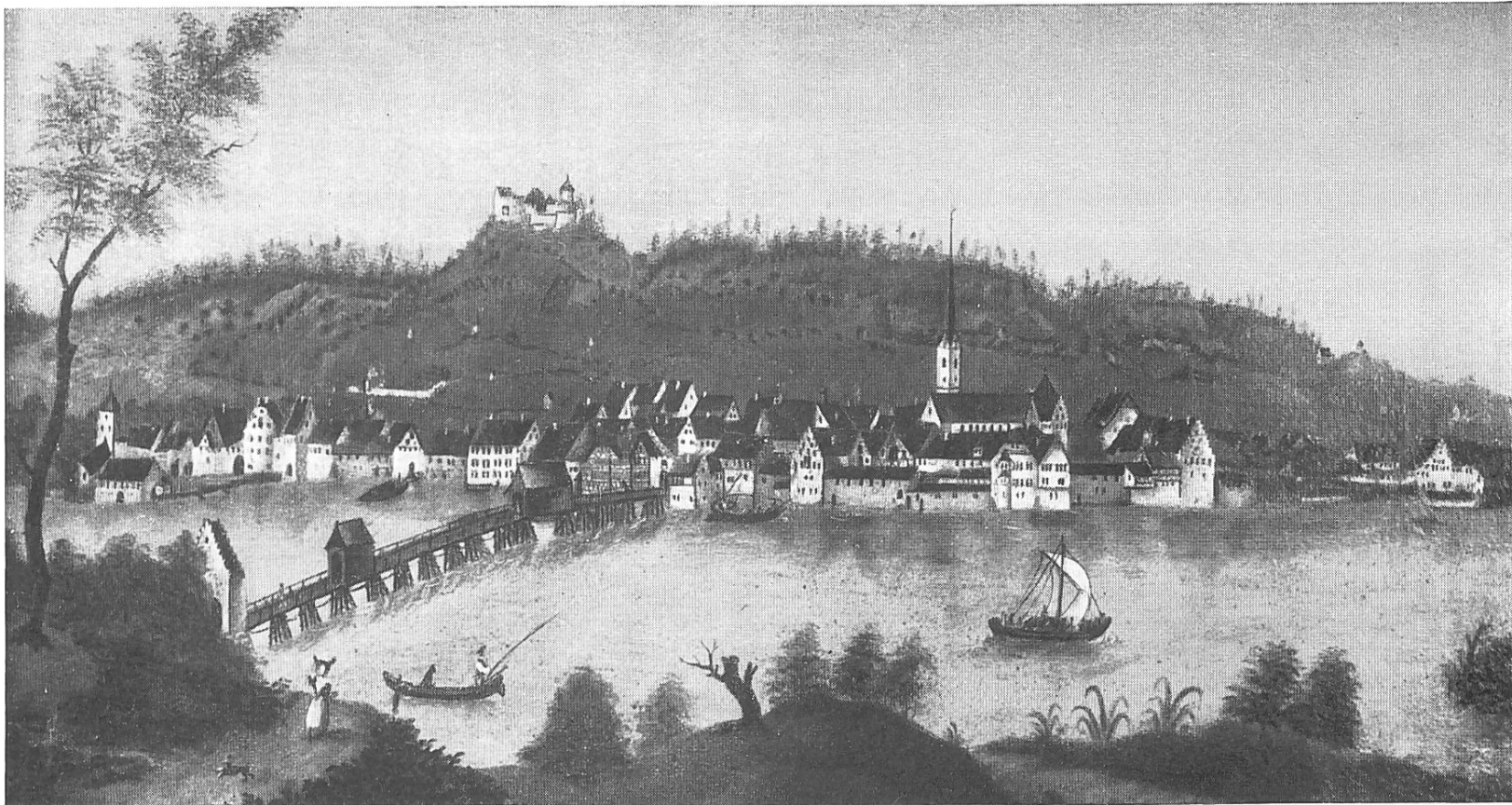
Die Stadt Stein am Rhein von Vorderbrücke aus, vor 1780 Der „Neubu“ ist neben dem Kaufhaus ersichtlich