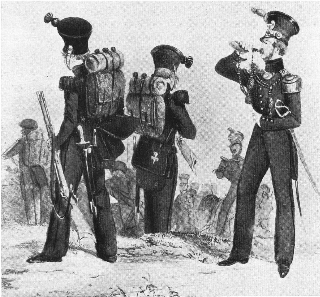
Bürcher Scharfschützen, 1818