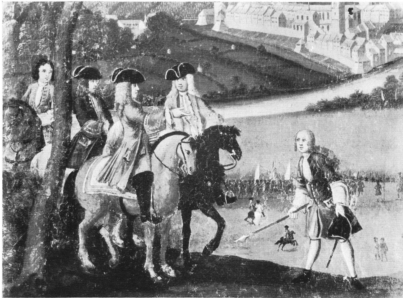
Bürcher Stab und grüßender Infanterieoffizier, unten Infanterie in Bereitstellung, anlässlich der Belagerung von Baden durch die Zürcher, 1712