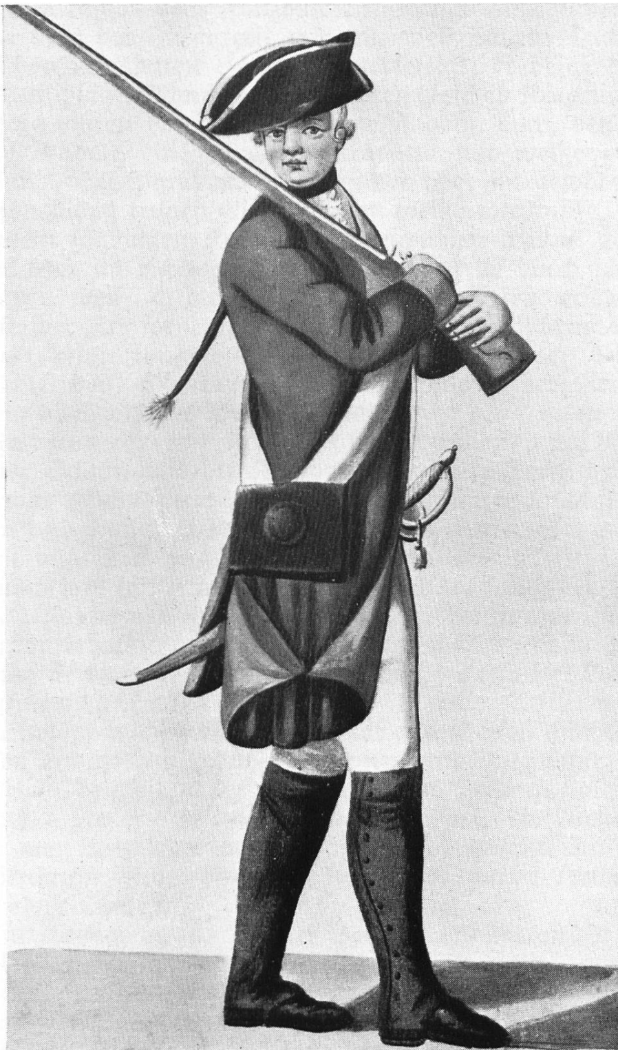
Zürcher Infanterist, Ende 18. Jahrhundert