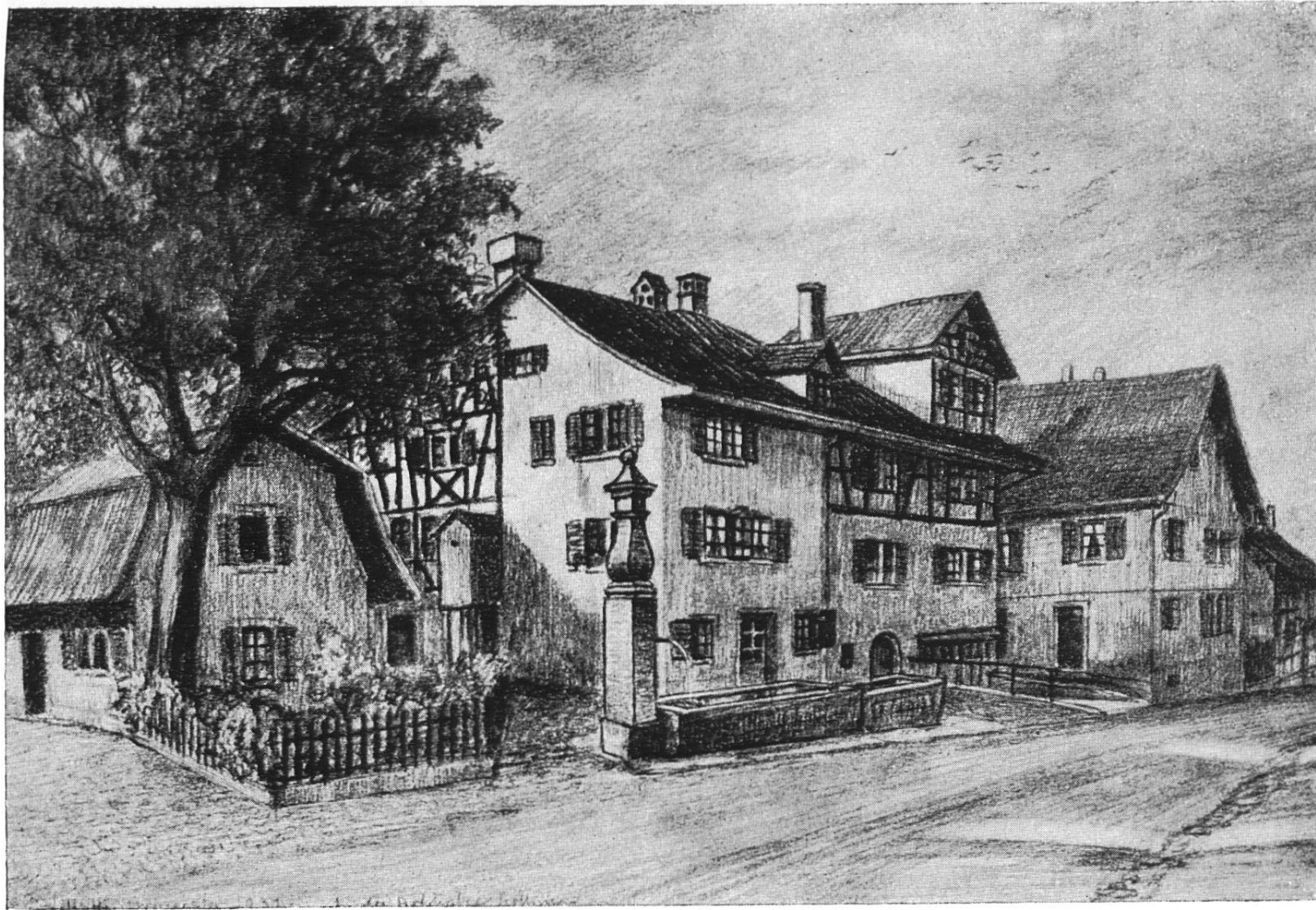
Dorfpartie an der Rühgasse, der heutigen Hofstraße Von H. Hintermeister, 1931