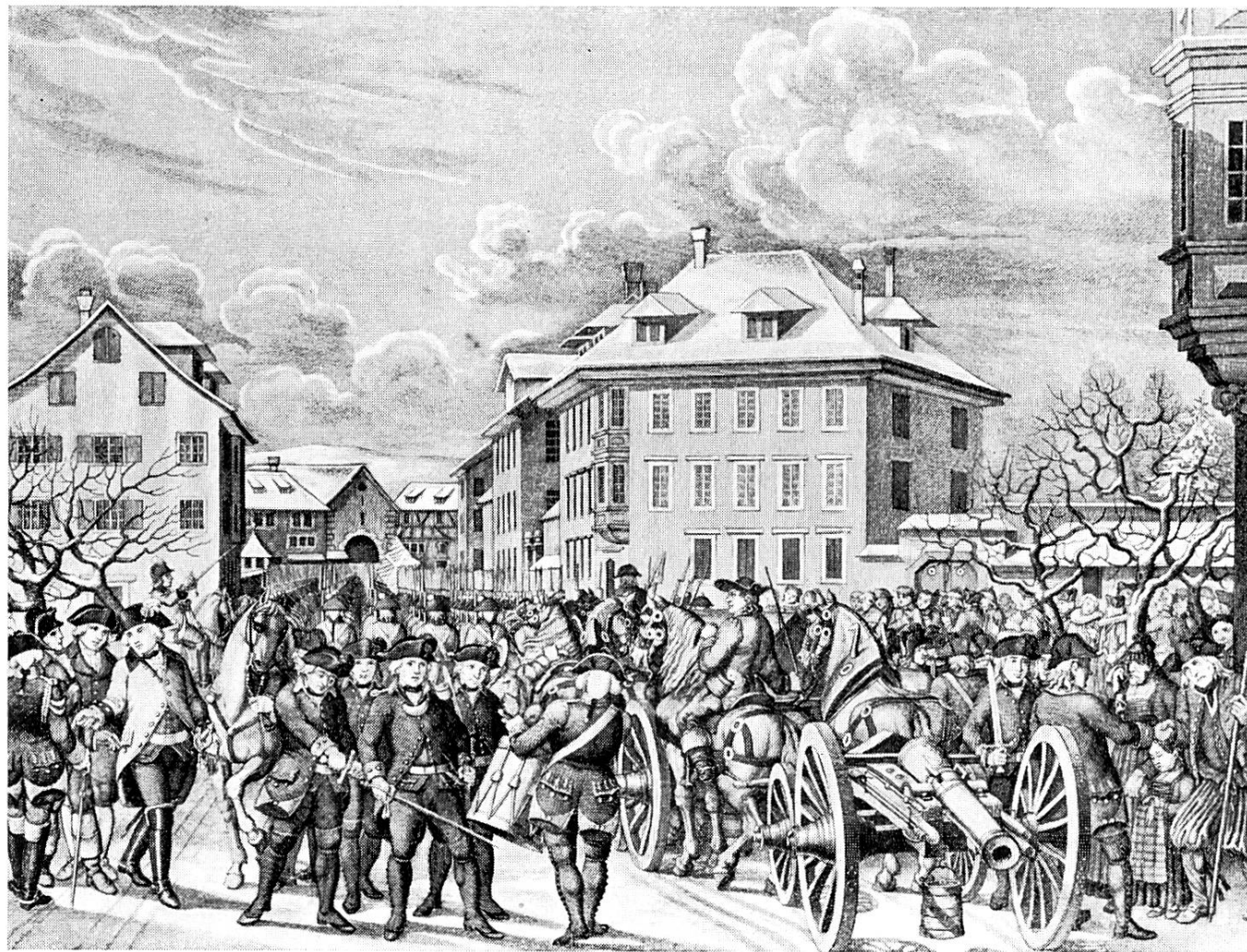
Auszug der Zürcher Truppen nach Bern, 1798