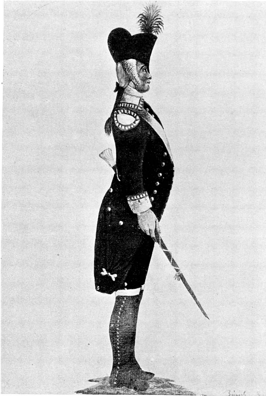
Zürcher Tambour-Major als eidgenössischer Buzüger 1798