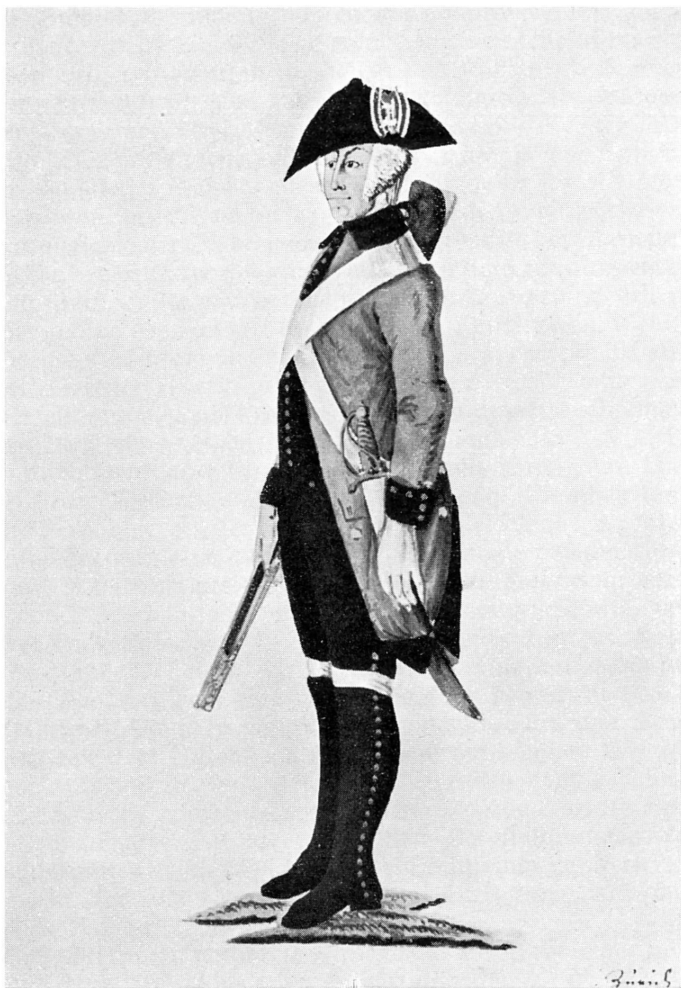
Gemeiner als eidgenössischer Fußkrieger