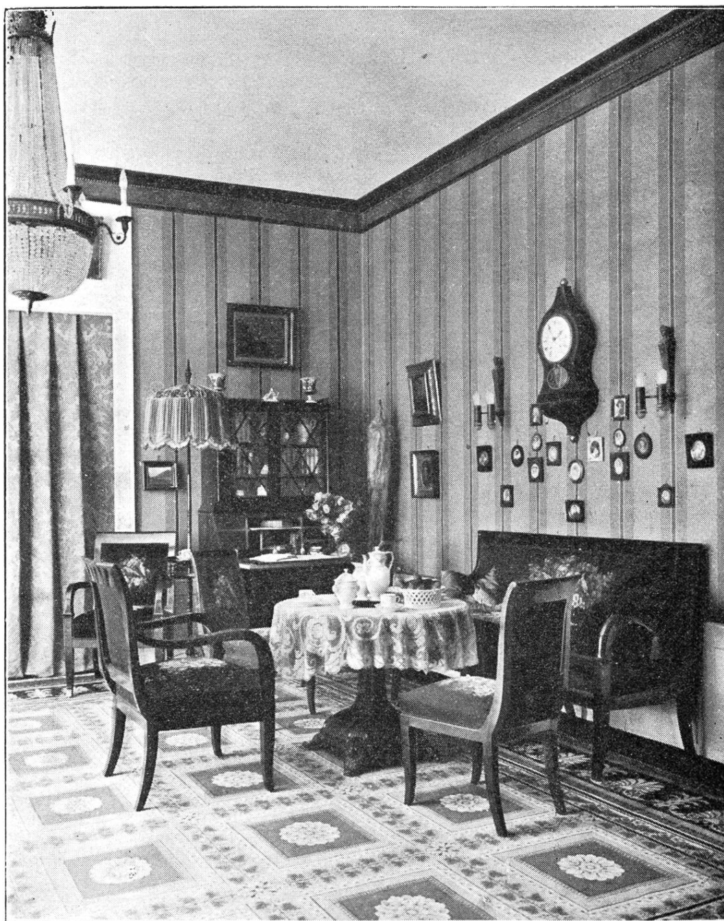
Biedermeier-Salon nach einem alten Original ausgeführt

J. KELLER & CIE INNENDEKORATION St. Peterstrasse 16 - Zürich