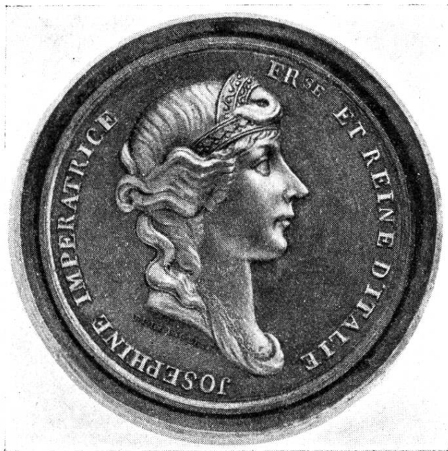
Medaille auf die Kaiserin Josephine. Heinrich Bullinger.

Louis d'or, blieb aber dennoch bei Herrn Geißler in Pension für monatlich 3 L.d'or. Im August 1804 reiste er nach Paris und trat bei H. Andrieu 64) , graveur en médailles, für 2 Jahre in die Lehre d. 29 Nov. 1804 für 25 L.d'or ohne Kost und Logis, welche zum Voraus bezahlt werden mußten. Den 9 Juli 1808 kam er wieder nach Zürich, nachdem er einen Ruf des Münzmeisters Fiolier ablehnend beantwortet hatte, wiewohl er zum voraus wußte, daß sein erlernter Beruf ihn zu Hause