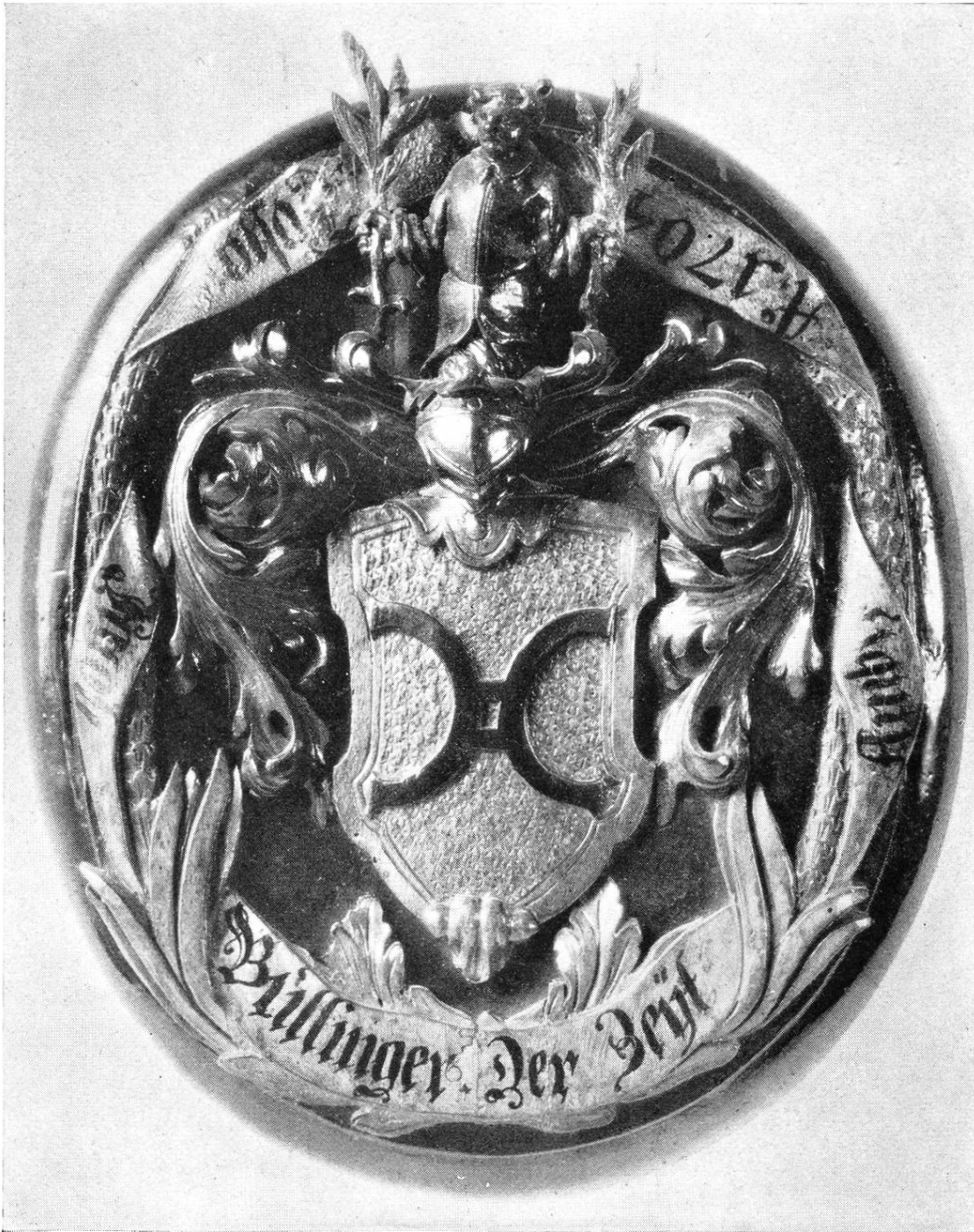
Wappen der Familie Bullinger