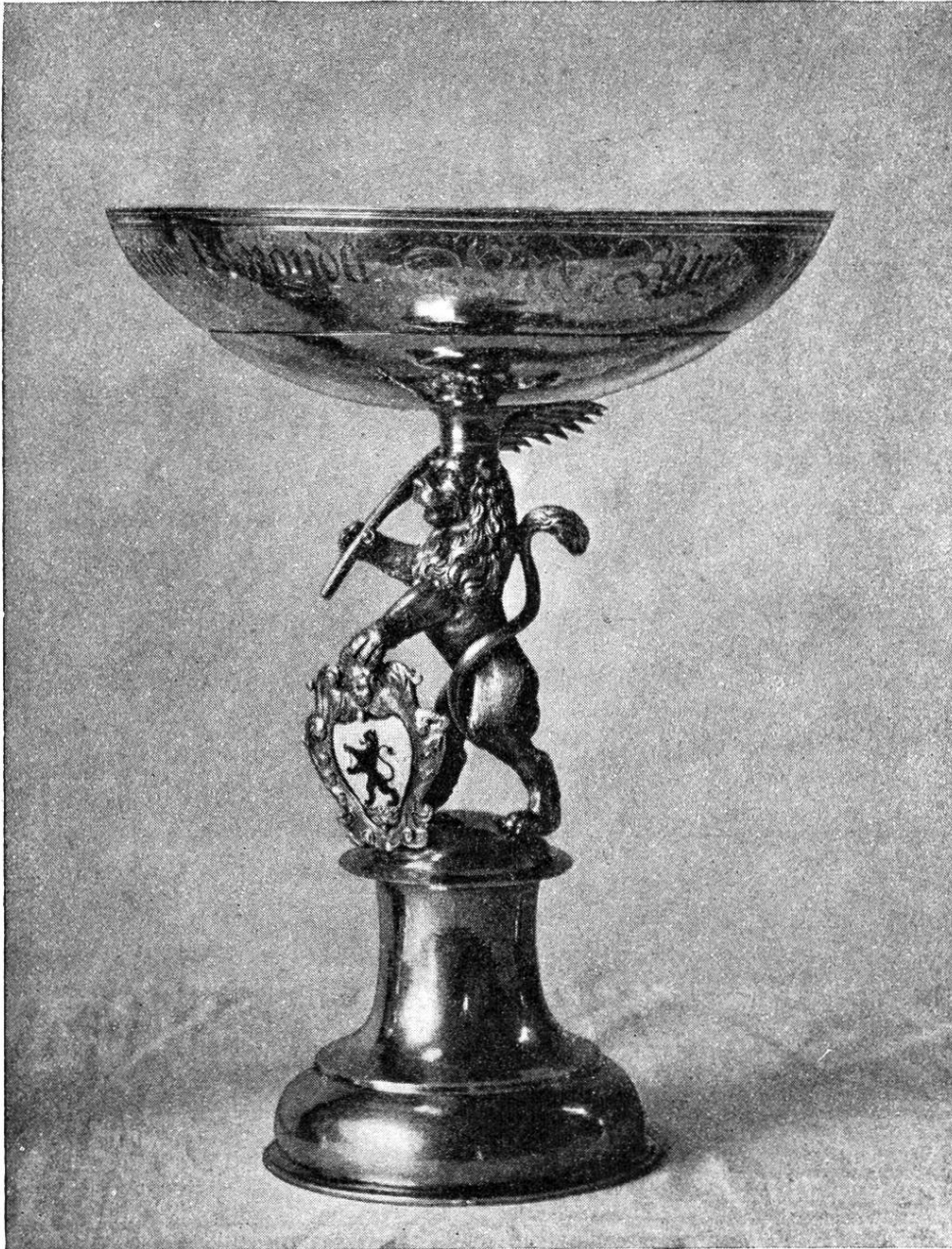
Schale des Bürgermeisters Sigmund Spöndlin. — Hans Jakob Bullinger (II). Geschenk an die Zunft zur Gerbi

die Angaben des Familien-Chronisten, daß der Bürgermeister in Sachen des Bullinger-Stipendiums in der That den Kürzern gezogen habe.