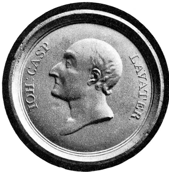
Medaille auf Joh. Casp. Lavater Heinrich Bullinger.

„Als seine treue alte Dienerin, welche von allen, besonders aber den jüngern Familiengliedern sehr geliebt wurde, dem baldigen Ende ihres treuen Wirkens entgensehen mußte,