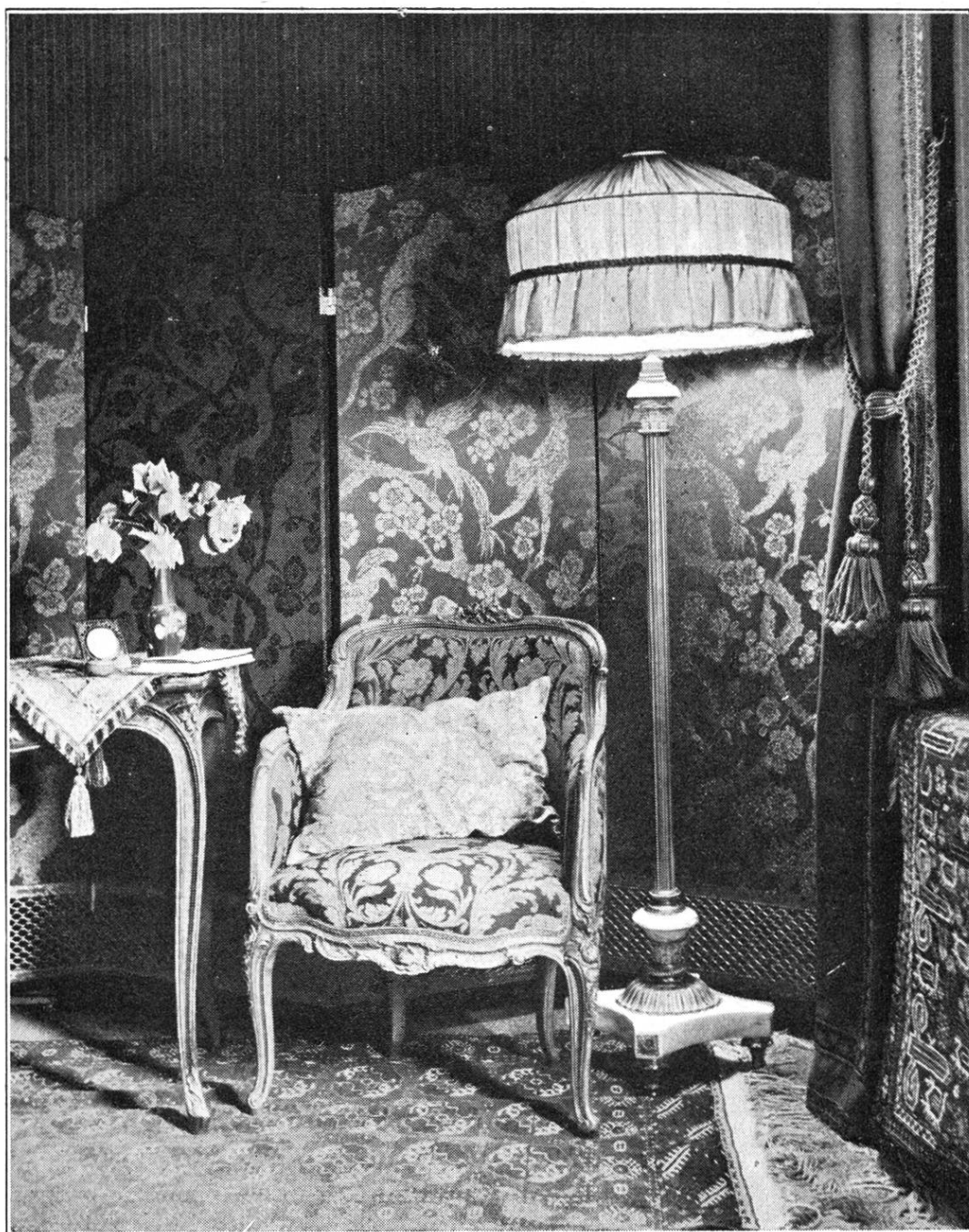
Fensterplatz in einem Boudoir

J. KELLER & CIE INNENDEKORATION St. Peterstrasse 16 ~ Zürich