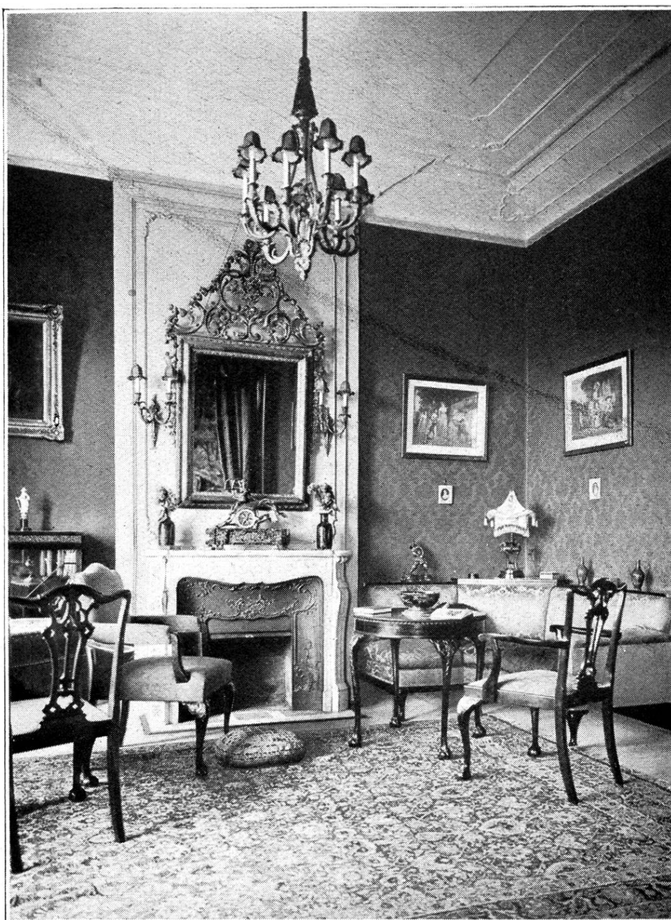
Salon in einer von uns eingerichteten Villa

J. KELLER & C IE INNENDEKORATION St. Peterstraße 16 — ZÜRICH