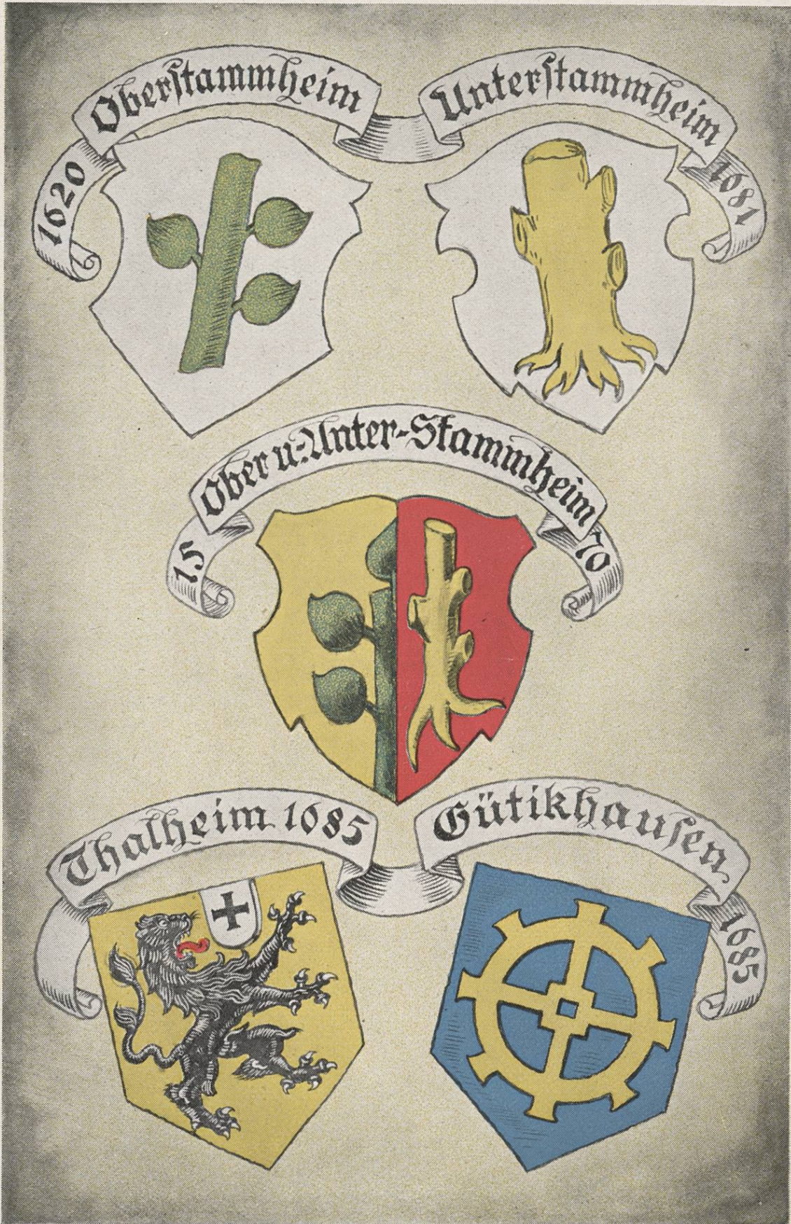
Wappen zürcherischer Gemeinden.