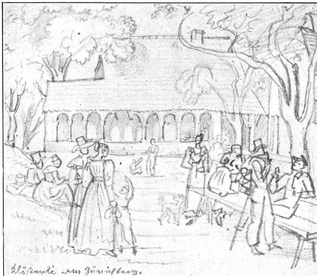
Das Klösterli am Zürichberg.