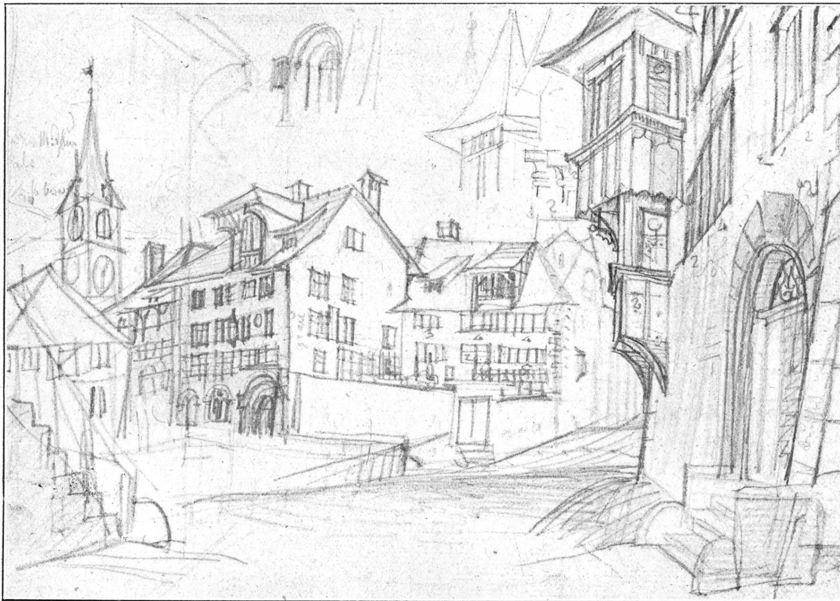
Der jetzige Zwingliplatz. Nach einer Zeichnung von Ludwig Vogel (ca. 1817). Text hierzu siehe Seite 255/258.