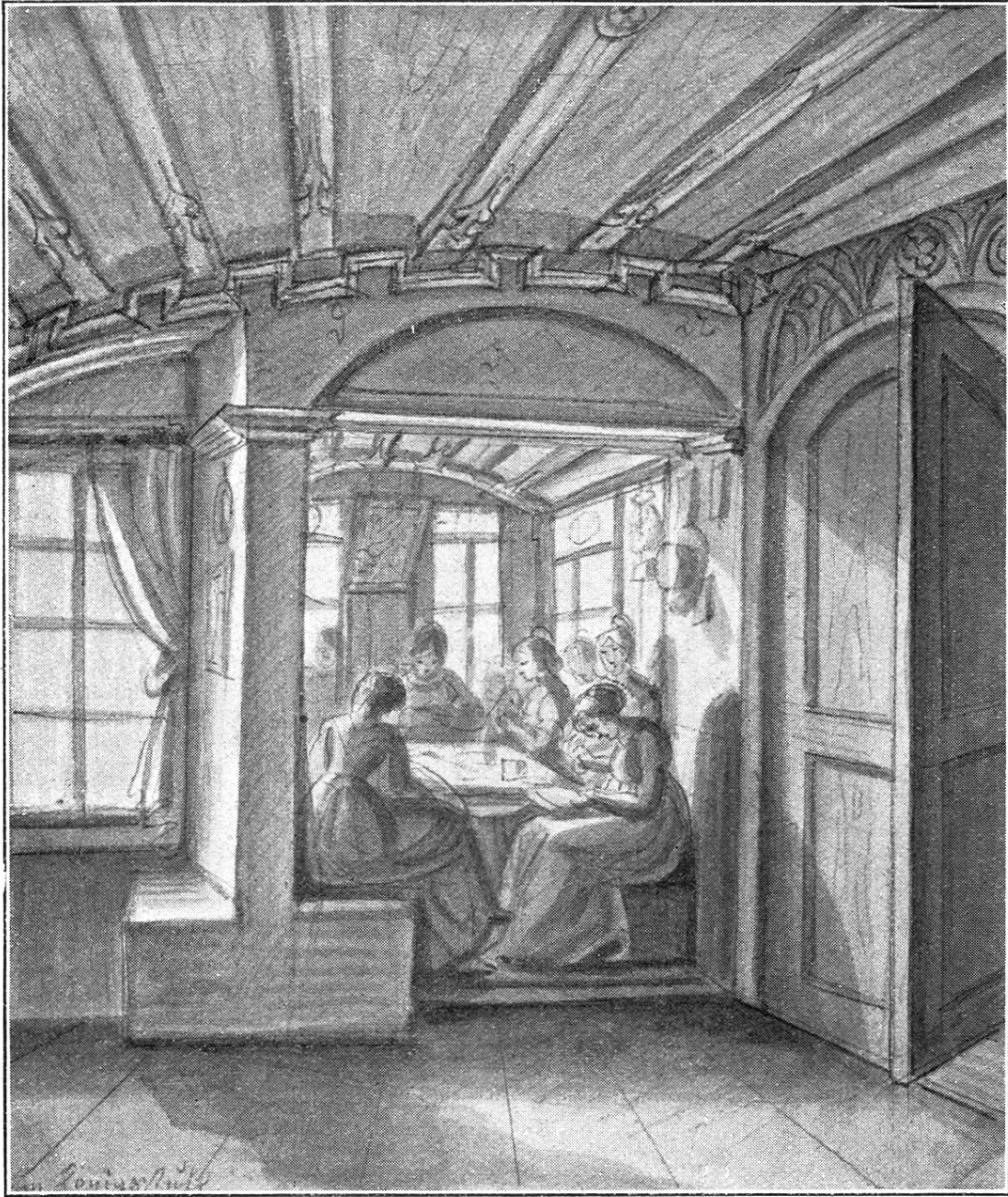
Erker im Haus zum Königstuhl. Nach einer Zeichnung von Ludwig Vogel.