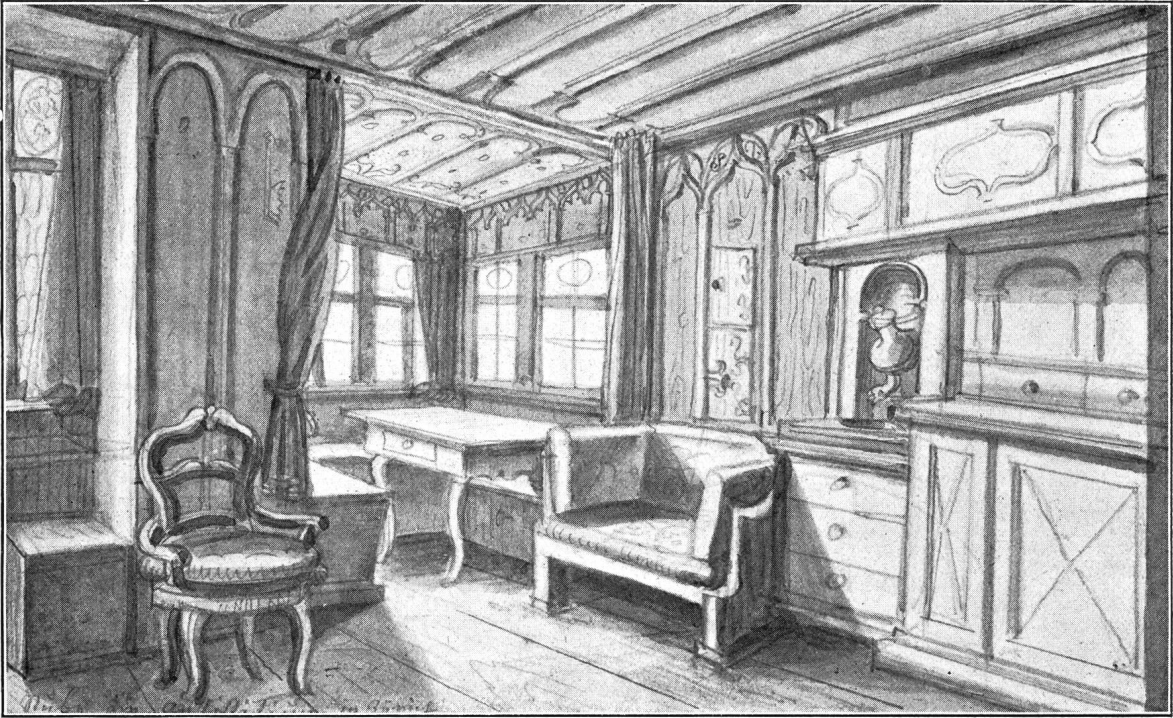
Erker im Antifistitium. Nach einer Zeichnung von Ludwig Vogel (ca. 1817).