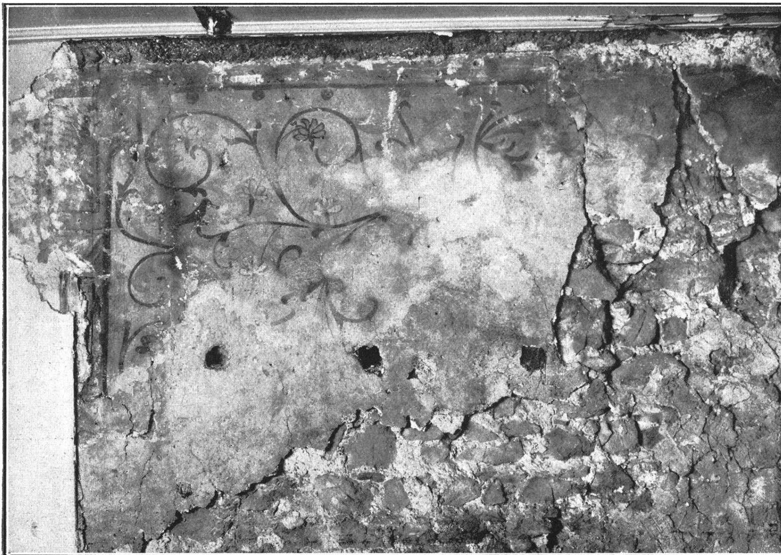
Wandmalereien im Sigriftenhaus St. Peter.