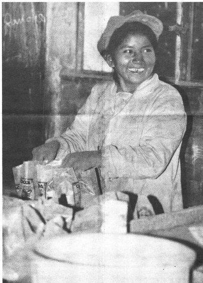
Kakaofüllung bei El Ceibo

Die Importstelle OS3, die seit 1988 ihren Sitz in der ländlichen Gegend von Orund etwas ausserhalb von Biel hat, könnte bildlich mit einer Spinne verglichen werden. Erstens die Form: wie dieses Tier hat OS3 im Vorderteil des Gebäudes einen vergleichsweise kleinen «Kopf», das heisst die paar Büroräumlichkeiten, von denen aus alles gesteuert und organisiert wird. Im grossen Hinterleib hingegen, der direkt angebauten Lagerhalle, befindet sich die ganze Verkaufsware (in die 1000 Produkte, bestehend aus Haushaltsartikeln, Spielen, Körben, Stoffen, Lebensmitteln, Taschen, Freizeitartikeln oder Geschenken von über 50 Produzentengruppen), das eigentlich Fleisch der Organisation.