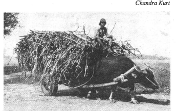
...des Vollrohrzuckers Mascobado