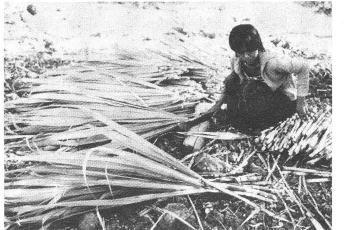
Die philippinischen ...

lich stammen die Genossenschaft nämlich aus dem Altiplano, wurden aber Mitte der sechziger Jahre wegen Bodenknappheit und der serbenden Bergbaubranche ins 4000 Meter tiefer gelegene Urwaldgebiet am Amazonas abgedrängt. Als «Starkapital» erhielten sie gerade ein paar Sacke Reis, eine Axt und etwas Dünger.