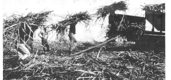
...des Vollrohrzuckers Mascobado