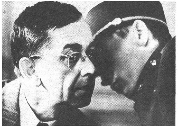
«Scharf beobachtete Züge» von Jiri Menzel

Von einer Zärtlichkeit ohnegleichen ist dieser Erstling – und gleichzeitig von einer erfrischenden Derbheit. Zwerchfellerschütternd wird da analysiert, wie ernst der Ernst des Lebens sein kann. Die prächtige letzte Chance dieses Semesters, den unterhaltsamen Osten kennenzulernen.