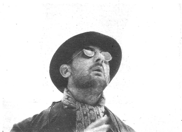
«Säugetiere» von Polanski

(Wer übrigens noch nicht genug von Skolimowski und Polanski gesehen hat, darf sich – pst – aufs Sommersemester freuen...)