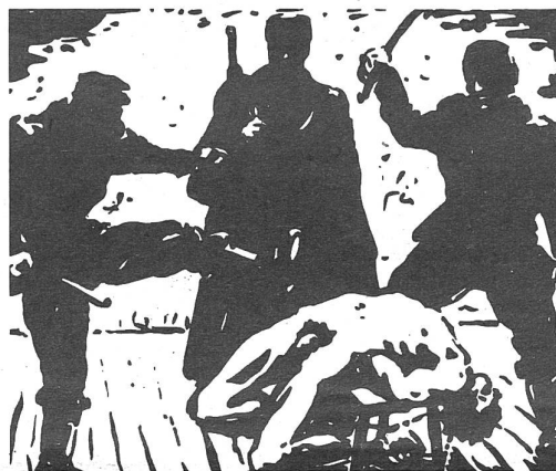
Folter in der Türkei: „Ein allgemeines Phänomen“

Die Hierarchisierung, die direkt im nationalen Sicherheitsrat (vom Staatspräsidenten ernannt) gipfelt, systematische Disziplinierung und Zensur, verankert