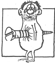
«Wartet nicht, bis man die Schraube anzieht...»

Die Wahl hat vor allem Repräsentationsfunktion gegen aussen. Prinzipiell steht der Vorstand allen Studenten offen, die mitarbeiten wollen; ihre Rechte unterscheiden sich nicht von denen, die gewählt worden sind. Die Organisationsform, ein Zwitter zwischen Fachschaft und BG, ist das Ergebnis der Ereignisse des letzten Semesters. Die Auseinandersetzung zwischen Studenten und Institutuleitung um den Inhalt eines Grundstudiumsplanes im SS 76 hatte - durch die patriarchalisches autoritäre Haltung der Institutuleitung