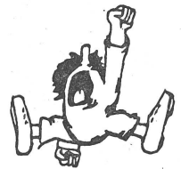
... tut etwas!»

Arbeitsgruppe Gruppenpraxis. Gesellschaftspolitisches Engagement und Gruppenpraxis; organisatorische und juristische Schwierigkeiten bei der Gründung einer Gruppenpraxis.