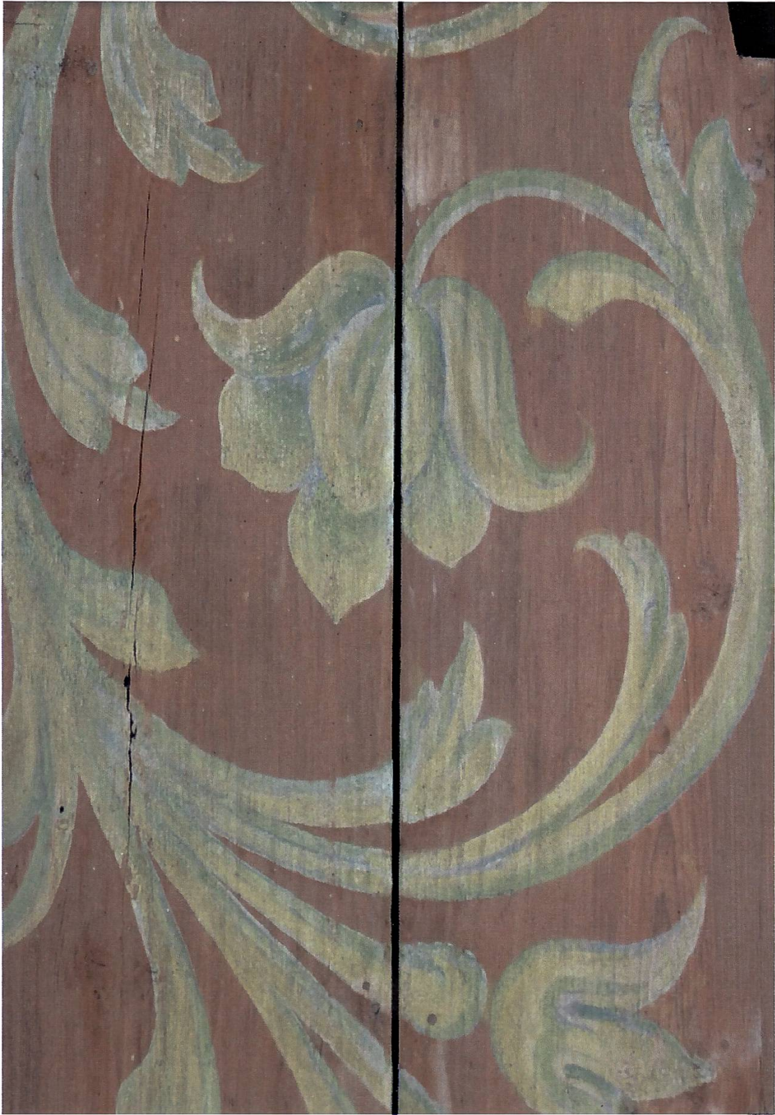
Museumsspeicher. Dekormalerei unter dem Vordach.