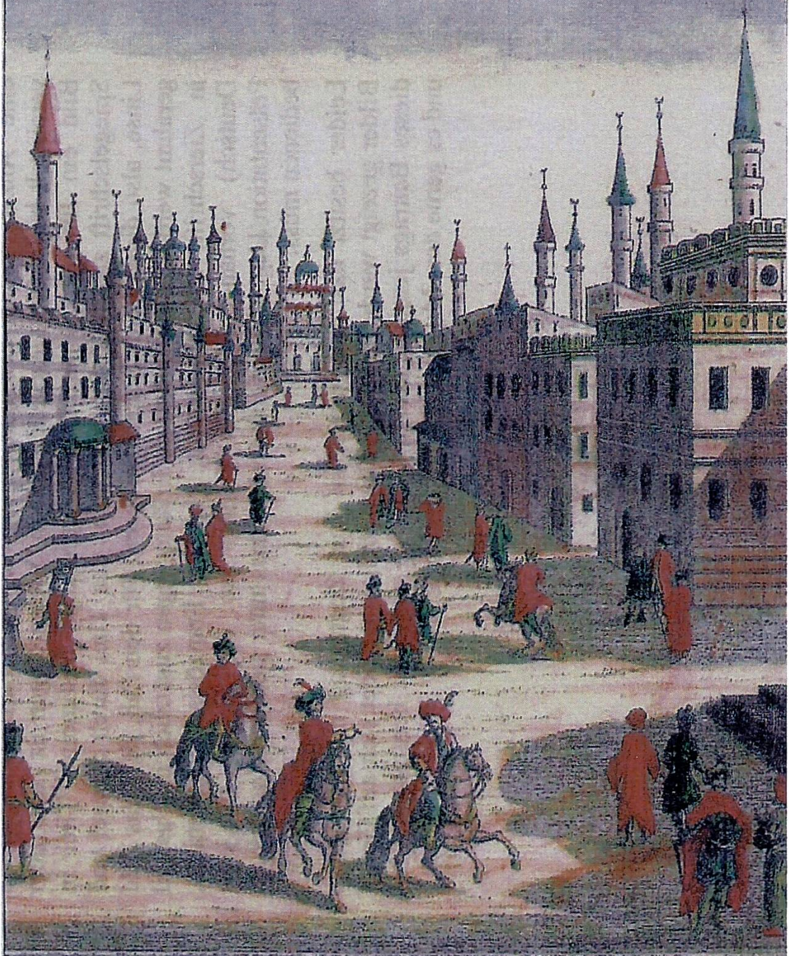
Vista delle sette Torri, ossia Prigioni di Stato a Costantinopoli. Prospect der Sieben Thürne, oder Staats-Gefängnis zu Constantinopel. Con Gratia et Privilegio Sac. Caes. Majestatis. Georg. Baldinger Professorum. 1714

VUE DES SEPT TOURS, OU PRISONS D'ETAT A CONSTANTINOPLE