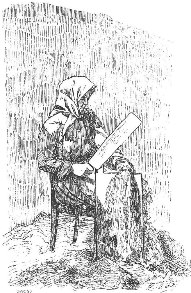
(Abb. 4.) Das Schwingen des Flachses.

An vielen Orten benutzte man statt des Schwingmessers eine Bürste. Die wegfliegenden Werchteile, „Abschwingete“