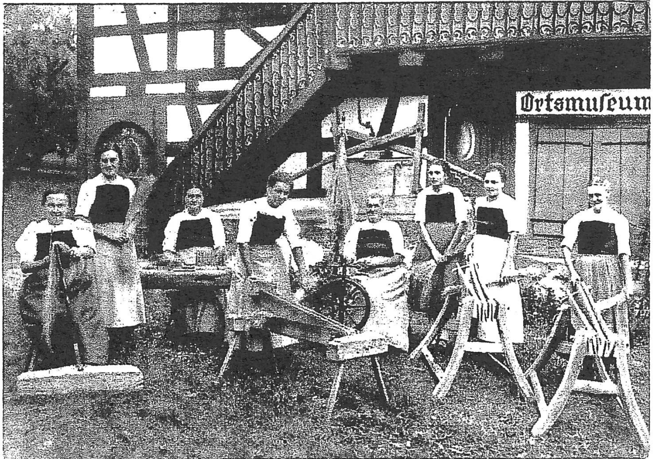
(Abb. 1.) Wehntalerinnen bei der Verarbeitung von Hanf und Flachs.