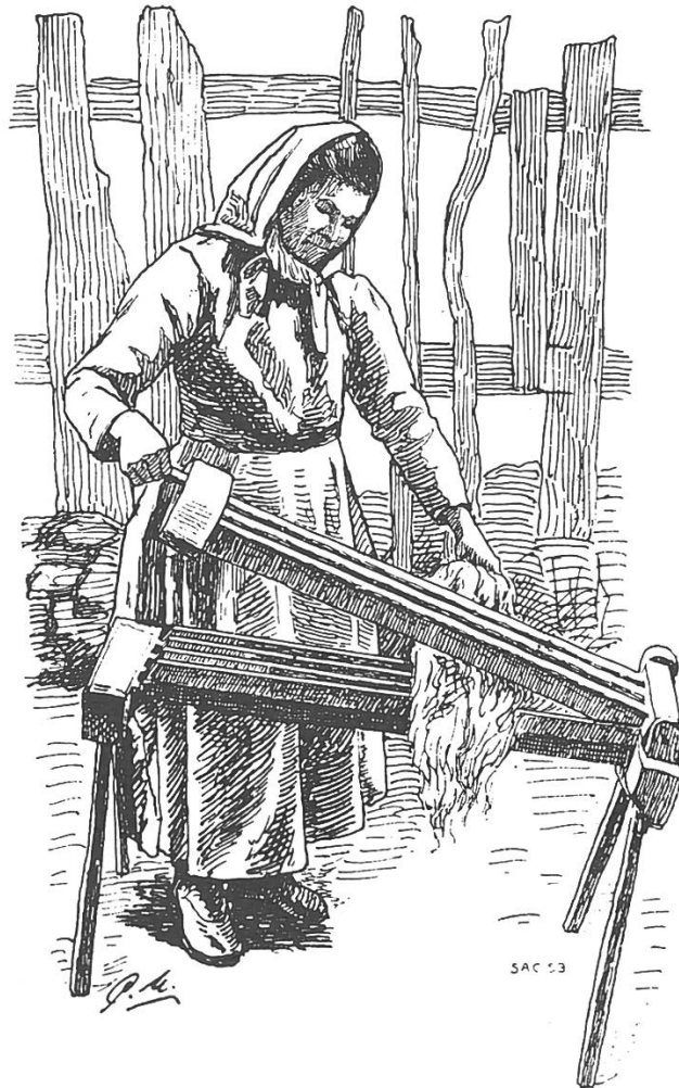
(Abb. 2.) Das Brechen des Hanfes.*

fugige Brechen. Die Hanfbreche hat sich bis in die heutige Zeit erhalten, wo sie zwar nur noch für die erste Behandlung der Hanfstengel benützt wird.