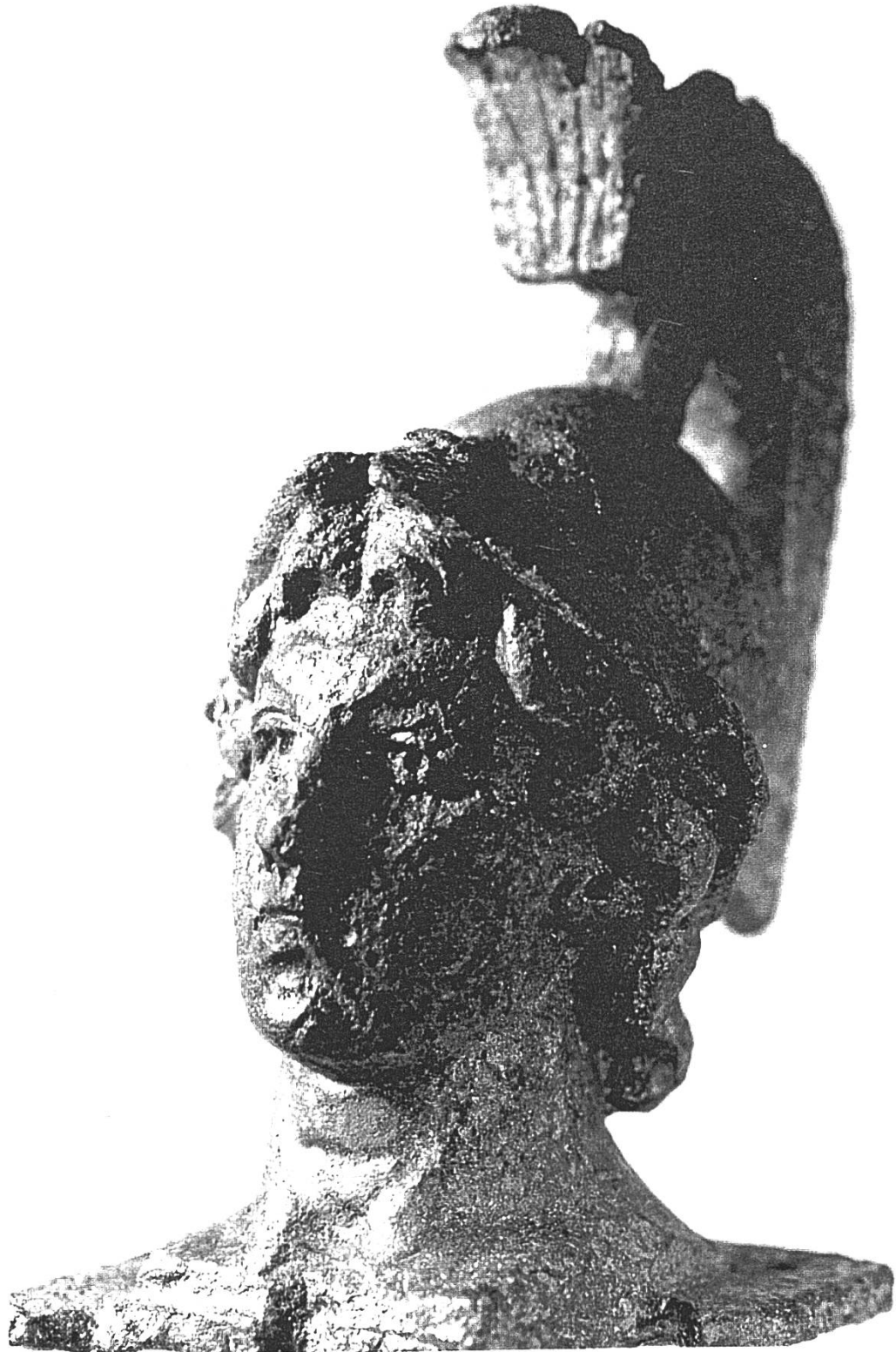
Abb. 2: Oberweningen ZH, Heinimürler. Büste der römischen Göttin Minerva aus Bronze. Höhe ca. 8 cm.