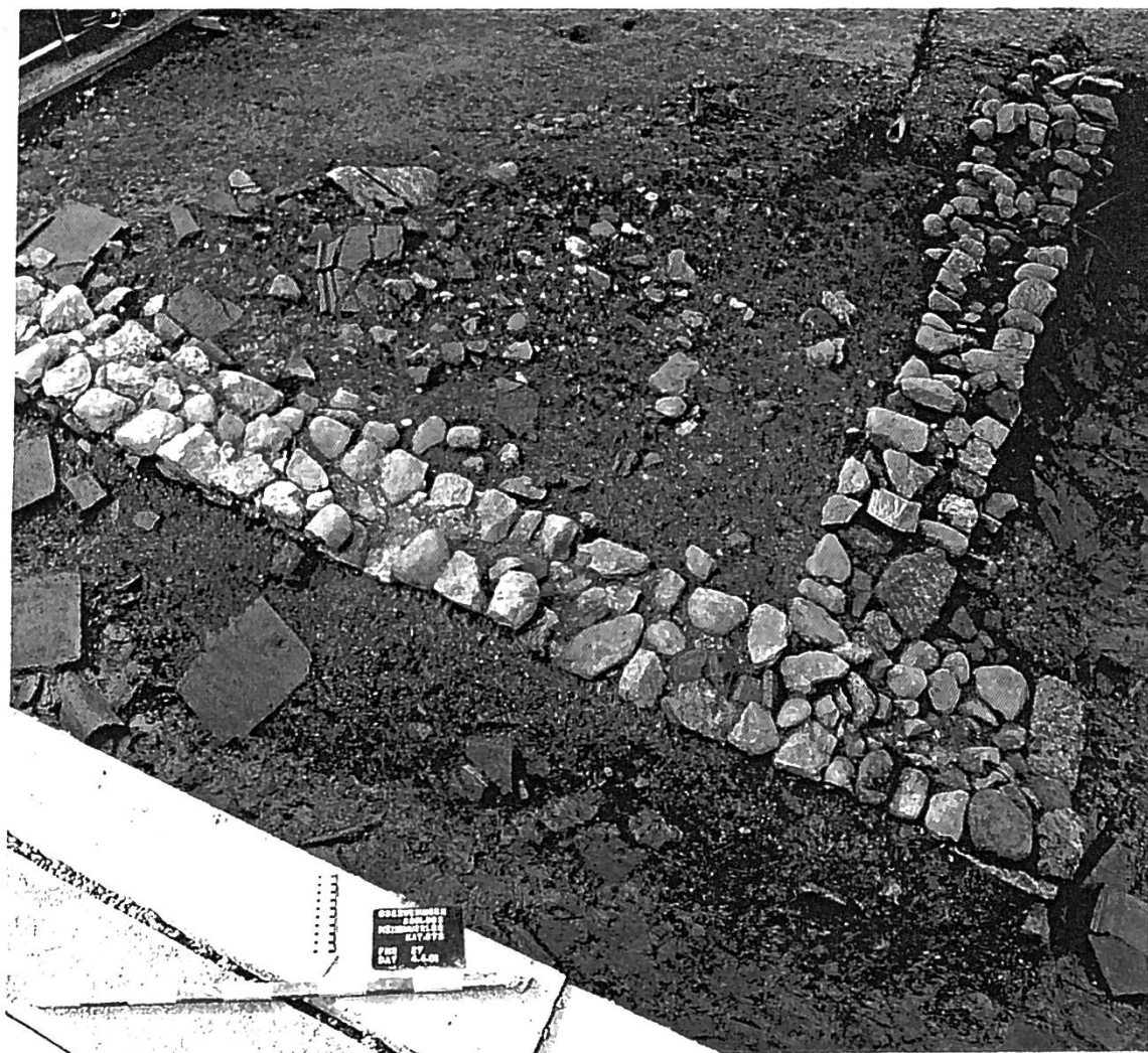
Abb. 3 Oberweningen ZH Heinimürler. Nordwestecke des zentralen Nebengebäudes (Gebäude D) mit Ziegeln des verstürzten Daches.