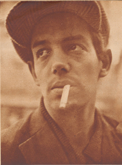
M. N., 26jährig, Kassenschlosser

Früher hat er immer Arbeit gehabt. 1924—1932 ist er in Nordfrankreich, wo er bei Kanalbauten als Maschinist, Maurer und Erdarbeiter mithilft. Da stellt Deutschland die Zahlungen ein, und der Kanal wird nur provisorisch fertiggestellt. Von den beschäftigten Arbeitern dürfen nur noch 10% Ausländer sein. Das Los soll entscheiden, wer gehen muß, und A. H. muß gehen. Er kehrt in die Schweiz zurück, arbeitet in vier verschiedenen Zeitabständen am Etzelwerk, steht stundenlang im Eiswasser, tief unten in einem Schacht, macht sich die Füße kaputt. Jetzt ist er Gelegenheitsarbeiter. Bei einem Gärtner würde er noch am liebsten arbeiten, doch auch Handlanger in einem Magazin könnte er sein. Ans Frühaufstehen ist er gewöhnt.