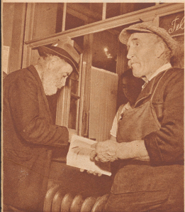
Die Papiere vorweisen!