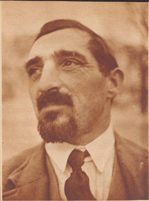
J. M., 45 Jahre alt, ursprünglich Bauschlosser

Bis zum 21. Jahre kann er «auf dem Beruf» arbeiten. Dann wird er abgebaut. Beim Wettinger Stauwehr findet er neuen Verdienst. Doch das Werk wird fertig, und die Arbeiter müssen gehen. Er auch. Ein Rohhändler in Wettlingen nimmt ihn als Knecht, obschon er von Pferden nichts versteht. Der Meister kommt in Konkurs und er muß auf den Tippel. Oft muß er im Freien nächtigen. Zwei ältere Geschwister will er nicht um Unterstützung bitten, weil sie ihm früher mal das Essen vorhielten. In Bern findet er wieder Arbeit als Kohlenmann. Doch schon am dritten Tag kommt die Berner Polizei dahinter und schiebt ihn, den völlig unbemittelten Aargauer, in die Heimatgemeinde ab. Jetzt ist er Gelegenheitsarbeiter, doch die Gelegenheiten sind selten. Ein Glück, daß er jetzt in die Kaserne darf, um dort die Militärsteuer für drei Jahre «abzuverdienen»