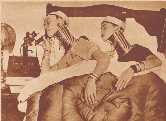
. . . . Ebenfalls in London sind eingetroffen: zwei Schönheiten aus Burma, deren Hälse bekanntlich – um sie möglichst zu strecken – mit einer Anzahl Kupferinge umhüllt werden. Auch zum Schlafen wird der zierliche Schmuck nicht abgelegt.