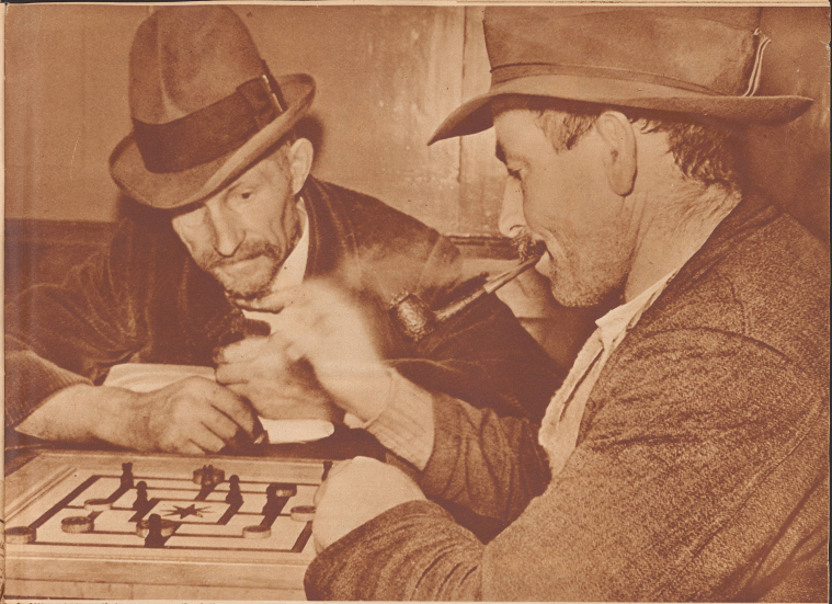
Zwei Herbergsbrüder beim „Nünimals“

Haben sie einen langen Tagemarsch hinter sich? Haben sie Arbeit gefunden? Jedenfalls fühlen sie sich jetzt geborgen, haben etwas Warmes im Magen und füllen die Stunde bis zur Schlafenszeit mit einem Spielchen. Sie sind ganz bei der Sache. Der Tag mit seinen Höhen kommt jetzt nicht so in beranz.