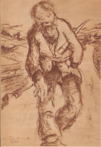
Der alte Vagabund

Aufnahmen aus der Herberge „Zur Heimat“ in Zürich von Max Seidel