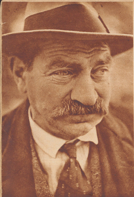
A. H., 55jährig, Maschinenschlosser

Früher hat er immer Arbeit gehabt. 1924—1932 ist er in Nordfrankreich, wo er bei Kanalbauten als Maschinist, Maurer und Erdarbeiter mithilft. Da stellt Deutschland die Zahlungen ein, und der Kanal wird nur provisorisch fertiggestellt. Von den beschäftigten Arbeitern dürfen nur noch 10% Ausländer sein. Das Los soll entscheiden, wer gehen muß, und A. H. muß gehen. Er kehrt in die Schweiz zurück, arbeitet in vier verschiedenen Zeitabständen am Etzelwerk, steht stundenlang im Eiswasser, tief unten in einem Schacht, macht sich die Füße kaputt. Jetzt ist er Gelegenheitsarbeiter. Bei einem Gärtner würde er noch am liebsten arbeiten, doch auch Handlanger in einem Magazin könnte er sein. Ans Frühaufstehen ist er gewöhnt.