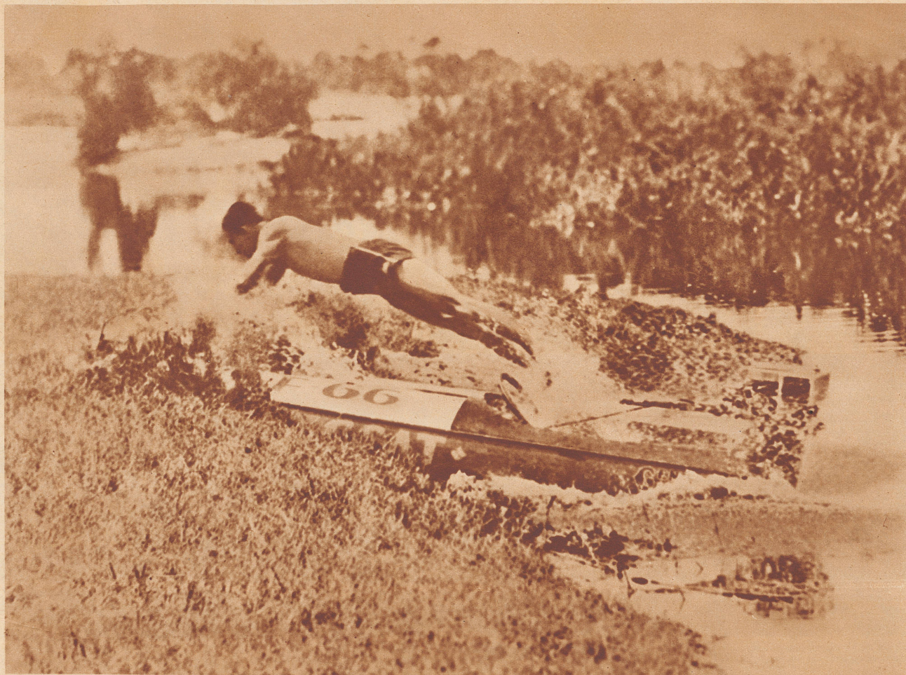
Diese gelungene Momentaufnahme zeigt einen Konkurrenten eines Motorbootverfolgungrennens in Amerika in dem Augenblick, da er ans Land geschleudert wird, während sein Boot in voller Fahrt sich ins Ufer einbohrt. Das geschah aus dem Grunde, weil der Fahrer eine Kurve nicht zu nehmen vermochte. Das Boot wurde schwer beschädigt. Der Mann blieb unverletzt.