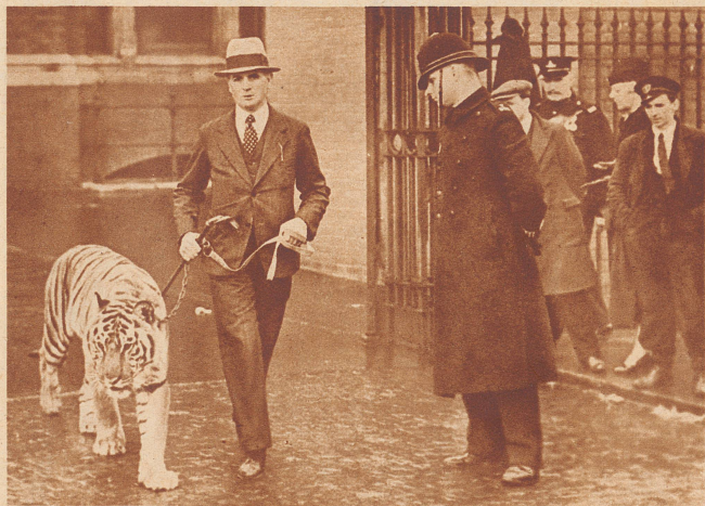
Vierzehn Tiger aus dem Hagenbeck'schen Tierpark in Stellingen sind in London angekommen, um im großen Olympiagebäude vorgeführt zu werden. Den ziemlich langen Weg vom Transportwagen in die Arena absolvierten die wilden Gesellen wie einen Spaziergang, bloß von ihren Wärtern an der Leine geführt . . . .