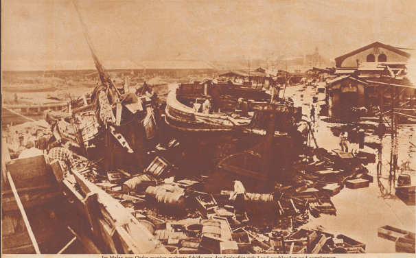
Im Hafen von Osaka wurden mehrere Schiffe von der Springflut aufs Land geschleudert und zerstört.