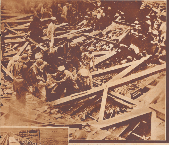
Rekordtote und Fellzei bei den Bergungarbeiten in einem eingestürzten Schulhaus. 500 Kinder wurden in dieser Schule vermisst, nur die Hälfte konnte lebend geborgen werden.