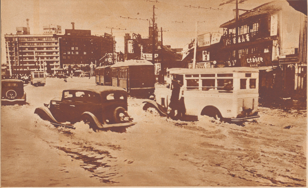
Während mehrerer Stunden waren die Straßen von Osaka meterhoch überflutet.