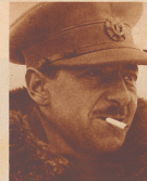
Oberst James Fitzmaurice , der bekannteste britische Flieger, der mit 1000 und 100000 Pfund die erste Ost-West-Ozeanüberquerung machte, geht mit einem neuen Bolson-Flieger in den Wettbewerb.