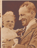
Sir Charles Kingsford Smith , bekanntester australischer Flieger, wird mit seinem Bolson-Flieger angetreten.