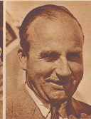
Sir Alan Cobham , einer der besten englischen Langstreckenflieger.