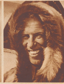
Kapitän Frank Hawks , der schnellste Flieger Amerika. Er hält gegenwärtig mit 6 1/2 Tagen den Rekord für den Flug Los Angeles-New York in 10 Stunden, 7 Minuten.