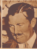
Oberst Roscoe Turner hält den Geschwindigkeitsrekord für den Nonstop-Flug über den amerikanischen Kontinent von Käte zu Käte. Die 4150 Kilometer lange Strecke Los Angeles-New York überdurfte er in 10 Stunden, 7 Minuten.