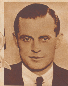
Graf von Sibirou , der bekannte französische Langstreckenflieger, hat sich durch verschiedene große Flüge nach Afrika und dem Fernen Osten ausgezeichnet.