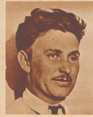
Wiley Post , der einzige amerikanische Wettflieger, hat im Jahre 1931 ein Weltumflug in 66 Tagen. Mit dem gleichen 148-er-Sportflugzeug «Winnie Mae» und er auf dem MacRobertson-Rennen brüvigen.