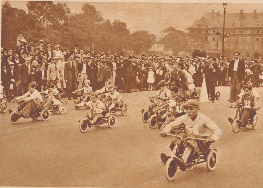
In Paris wurde kürzlich ein Radrennen für Kinder veranstaltet, die auf kleinen dreirädrigen Motorvelos fuhren. Ihr seht die jungen Rennfahrer gerade kurz nachdem das Zeichen zum Start gegeben wurde. Wer hat wohl den Großen Preis gewonnen?