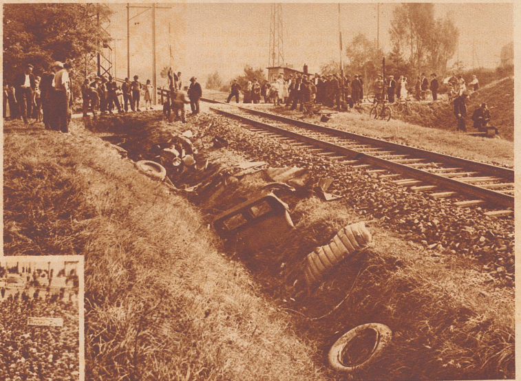
Was übrig blieb. Auf einem unbelichteten Niveauübergang bei der Kaserne Bülach wurde in der Nacht vom 15. zum 16. September ein Personenautomobil von einem Schnellzug überfahren und total zertrümmert. Der Lenker des Wagens wurde sofort getötet. Zwei Mitfahrende konnten sich durch Abspringen retten.