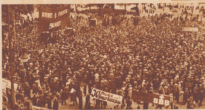
«Tag der Arbeit». In den meisten größeren Ortschaften der Schweiz fand am Sonntag, den 23. September, eine von der Sozialdemokratischen Partei, dem Gewerkschaftsbund und dem Föderativverband des eidgenössischen Personals organisierte Kundgebung statt. In Zürich nahmen an dem Umzug durch die Stadt und der Versammlung auf dem alten Tonhalleplatz rund 12 000 Personen teil.