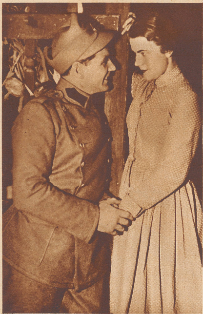
Attila Hörbiger und Paula Wesseley, zwei bekannte und beliebte Schauspieler, die unzählige Male im Theater ein Paar zu spielen hatten, haben sich unlängst verheiratet. Bild: Paula Wesseley und Attila Hörbiger als Partner in der Aufführung des Stückes: «Die Braut von Torocko».

Prinz Georg, der jüngste Sohn des englischen Königspaares, hat sich mit der griechischen Prinzessin Marina noch nicht vermählt, aber verlobt. Endlich wieder einmal eine königliche Heirat, die mit beiderseitiger elterlicher Zustimmung erfolgen wird!