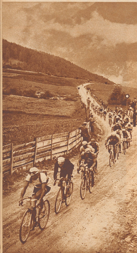
II. Etappe: Die Fahrer beim Aufstieg nach der Lenzerheide.