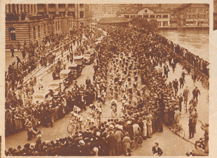
Der Start zur ersten Etappe auf dem Bahnhofquai Zürich, Samstag, den 25. August, morgens 8 Uhr. Eine riesige Menschenmenge säumte die Straßen der Stadt, durch die 57 Konkurrenten aus 7 Nationen ihren Weg nahmen.