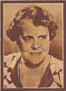
† Marie Dressler