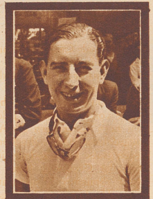
Guy Moll †

der bekannte algerische Automobil-Rennfahrer, verunglückte tödlich beim Rennen um den Coppa d'Acerbo in Pescara.