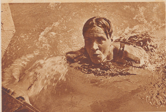
Der St. Galler Mehrmann blieb in Basel überlegener Sieger im Schwimmen. Seine Zeiten: 400 m Freistiel 6 Minuten, 44 Sekunden; 100 m Freistiel 1 Minute, 10,6 Sekunden. Neuer Hochschul-Rekord: 100 m Rücken 1 Minute, 30 Sekunden.