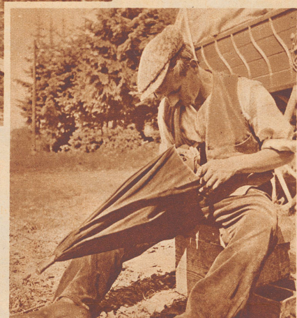
Der Vater Schirmflicker bei der Arbeit. Er muß sich tüchtig ins Zeug legen, weil die Schirme noch am gleichen Abend ins Dorf zurück müssen.

Die Auflösung zu dem Photoscherzrätsel erfolgt in der nächsten Nummer