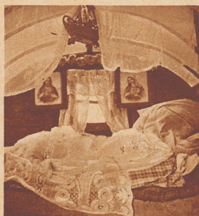
Es sieht nicht gerade ordentlich aus, dieses Bett, aber bei den fahrenden Leuten hat das nichts zu sagen.