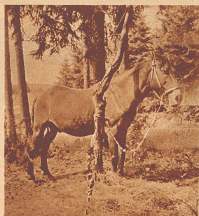
Unter den schattigen Bäumen ist das kleine kräftige Pferd angebunden.

Nur über Samstag und Sonntag dürfen sich die Schirmflicker einen Ruhetag gönnen. Dann hat die Mutter Zeit, die Kinder blank und sauber zu waschen und zu kämmen. Und das ist manchmal bitter nötig. Wenn