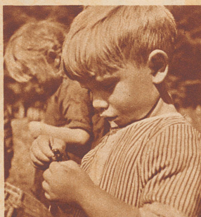
Der kleine Bub hat sich in der Wiese etwas zum Spielen geholt. Diesmal ist's eine Grille, die er eingehend betrachtet.

man denkt, daß sich die Kleinen den ganzen Tag in Wiesen und Straßengraben und Steinbrüchen herumtreiben, ganze Kessel voll Grillen als Spielzeug nach Hause schleppen — dann kann man sich vorstellen, daß sie nicht immer sehr reinlich aussehen. In die Schule können natürlich die Korbflickerkinder nicht, das ist wohl zu verstehen, denn sie haben ja jeden Tag «Züglete». Das hat seine Vorteile und Nachteile. Mit dem «lustigen Zigeunerleben», wie es im Liede heißt, ist's eigentlich nicht so weit her.