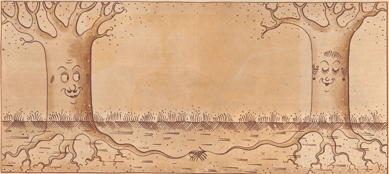
Die heimlich Verliebten

Zeichnung von Hans Sinogli (Bavaria-Verlag)