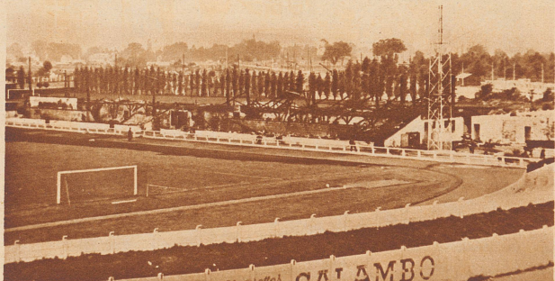
Die schönste Sportplatztribüne der Schweiz abgebrannt. In der Nacht vom 16. zum 17. Mai ist die 100 m lange und 20 m tiefe, 3000 Personen fassende Zuschauertribüne auf dem Zürcher Grasshoppers-Fußballplatz mit allen Nebenanlagen: Toiletten, Abwartwohnung, Klubrestaurant und Mobilier vollständig abgebrannt. Der Schaden beträgt 300 000 Franken. Bild: Blick auf die Ruinen.