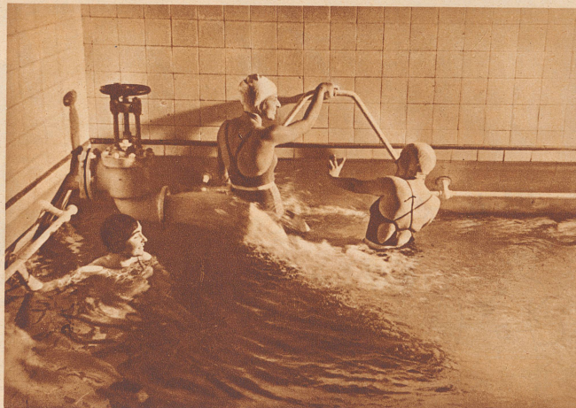
Das Schwimmbassin des Ragazer Thermalbades enthält 720 000 Tagesliter warmes Wasser