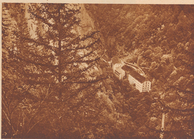
Das Badhotel Pfäfers liegt in der Taminaschlucht, in nächster Nähe der warmen Quelle.

Ragaz-Pfäfers im St. Galler-Oberland besitzt beinahe tausendjährigen Weltruf. Die heißen Quellen von Ragaz-Pfäfers entspringen mit einer Wärme von 37 Grad Celsius in der Taminaschlucht. Die Heilwirkung der Thermen von Ragaz-Pfäfers erstreckt sich besonders auf Stoffwechselkrankheiten, Rheumatismus, Ischias, Störungen des Blutkreislaufs, Arterienverkalkung und Venenleiden.