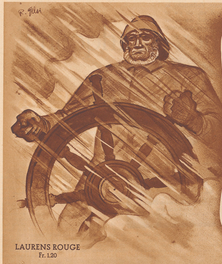
LAURENS ROUGE Fr. 1.20

Erfahrung - kann man niemals kaufen! denn sie ist stets das Produkt aus jahrelangem heissen Ringen nach Vollkommenheit, aus Wissen, das nur die Erprobung schaffen kann!... Ein alter Name ist infolgedessen stets der Bürge für Erfahrung, denn durch sie - hat er ja erst Gewicht erlangt! Sinnfällig zeigt darum der Name einer Zigarette schon, welch' Hochgenuss sie bieten muss: