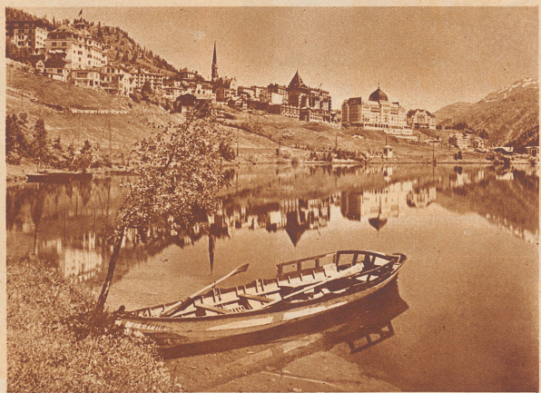
100 Jahre später. St. Moritz-Dorf und sein Gesicht zu heute.