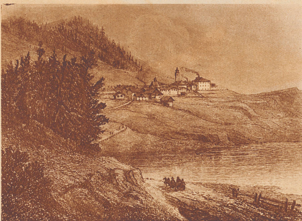
St. Moritz-Dorf vom Bad aus gesehen, nach einem Stich aus dem Jahre 1836.

Baden. Schon der römische Geschichtsschreiber Tacitus hat die Bäderstadt Baden an der Limmat erwähnt. Funde von Tempelüberresten, Münzen und zahlreichen medizinischen Instrumenten zeugen dafür, daß Baden bereits zur Römerzeit der weitaus wichtigste Badeplatz diesseits der Alpen war. Baden besitzt 17 aktive Chlornatrium-Schwefelquellen von 48 Grad Celsius, deren Anwendung sich besonders bei Stoffwechselkrankheiten, Rheumatismen, Gicht, Ischias, Katarhen und Bewegungsstörungen bewährt. Badens Ruhm ist zu jeglichen Zeiten und von Dichtern aller Nationen in die Literatur eingegangen. Was über Baden gesagt werden konnte, hat der Zürcher Dichter David Heß in seinem berühmten Buche «Die Badenfahrt» zusammengefaßt. Und über das heutige Baden berichtet Hermann Hesse in seinen einzigartigen Aufzeichnungen: «Der Kurgast».